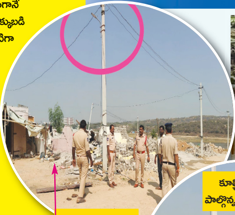
భూ కబ్జాదారులకి విద్యుత్ అధికారుల ప్రోత్సాహం.. విద్యుత్ మీటర్లు..

ఎనిమిది అక్రమ నిర్మాణాలు కూల్చివేసిన అధికారులు..