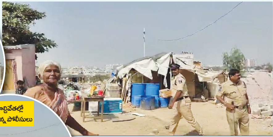
కూల్చివేతల్లో పాల్గొన్న పోలీసులు

భూ కబ్జాదారులకు సహకరించడంలో విద్యుత్ అధికారులు ప్రధాన పాత్ర పోషిస్తున్నారు.. జిహాచ్ఎంసి పరిధిలో అక్రమ నిర్మాణాలకు ట్రాన్స్ఫార్మర్లు..! ప్రభుత్వ భూముల్లో అక్రమ కట్టడాలకు అధిక మొత్తంలో లంచాలు పుచ్చుకుని యధేచ్ఛగా మీటర్లు ఇస్తున్న విద్యుత్ శాఖ అధికారులని సస్పెండ్ చేస్తే కబ్జాలకు కొంత బ్రేక్ పడుతుంది.. మరోవైపు కబ్జాదారులకు రెవెన్యూ అధికారుల సహకారంపై కలెక్టర్ ధృష్టి సారించి చర్యలు తీసుకోకపోతే ప్రభుత్వ భూములు అన్యాయం అయ్యే అవకాశం ఉంది..