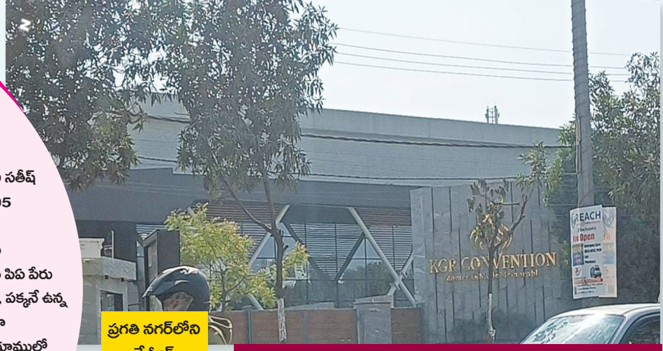
ప్రగతి నగర్ లోని కేజీఆర్ కన్వెన్షన్ లో నాలాల ఆక్రమణ..