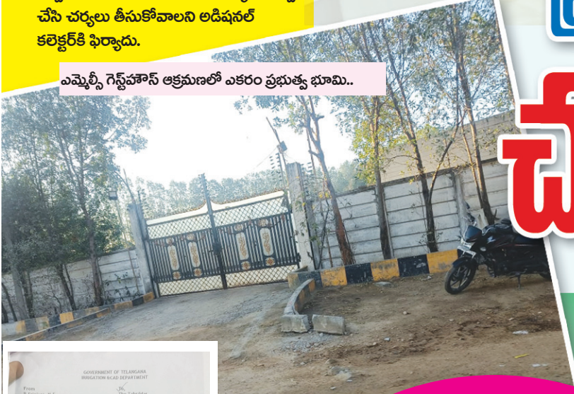
ఎమ్మెల్సీ గెస్ట్ హౌస్ ఆక్రమణలో ఎకరం ప్రభుత్వ భూమి..