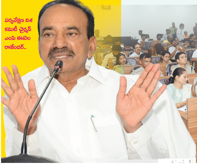
పర్యవేక్షణ దిశ కమిటీ చైర్మన్ ఎంపి ఈటెల రాజేందర్..