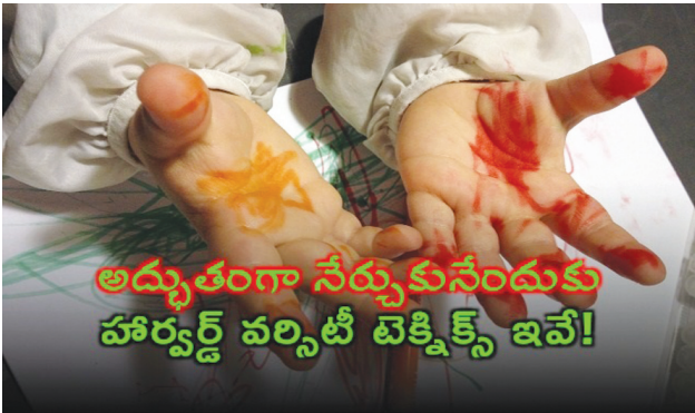
అద్భుతంగా నేర్చుకునేందుకు హార్వర్డ్ వర్మిటీ టెక్నిక్స్ ఇవే!

హైదరాబాద్ పెన్ పవర్:చదువుకునే వారి నుంచి ఉద్యోగం చేసే వారిదాకా... అందరికీ ఎప్పుడూ కొత్త అంశాలు నేర్చుకోవడం తప్పనిసరి. చదువులో ముందుండాలన్నా, ఉద్యోగంలో, కెరీర్ లో పైకి ఎదగాలన్నా... నిరంతరం నేర్చుకుంటూనే ఉండాలన్నది అందరికీ తెలిసింది. ఈ క్రమంలో ఐదు రకాల యాక్టివ్ లెర్నింగ్ టెక్నిక్స్ తో ఏదైనా సులువుగా, అద్భుతంగా నేర్చుకోగలమని హార్వర్డ్ విశ్వవిద్యాలయం నిపుణులు చెబుతున్నారు. చిన్న పిల్లలు, విద్యార్థుల నుంచి పెద్ద వయసు వారిదాకా ఎవరైనా ఈ టెక్నిక్స్ పాటిస్తే ప్రయోజనం ఉంటుందని సూచిస్తున్నారు.