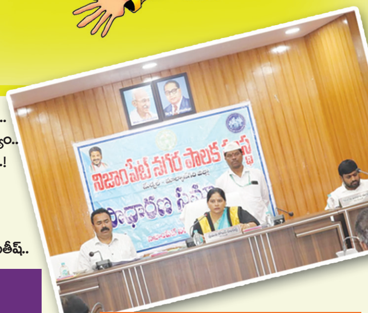
రూ.500 కోట్ల బడ్జెట్లో.. ప్రజల అవసరాలు తీర్చలేక పోయారు..