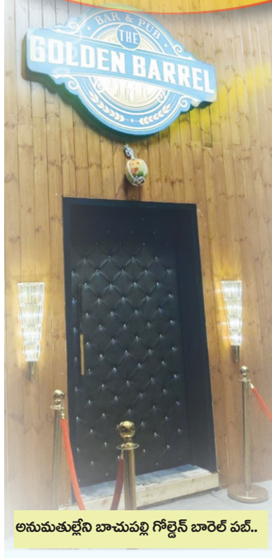
అనుమతుల్లేని బాచుపల్లి గోల్డెన్ బారెల్ పబ్..