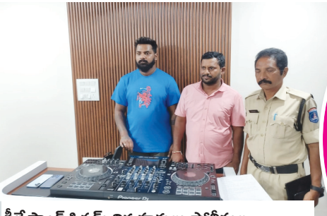
డీజే సౌండ్ సిస్టమ్ నిర్వహకులు పోలీసుల ఆధీనంలో.. ఫైల్ ఫోటో..

గత పదేళ్ళ బీఆర్ఎస్ ప్రభుత్వ పాలనలో విసుగెత్తి కొత్తదనంకోసం పాకులాడిన ప్రజలకు చుక్కెదురైందని చెప్పాలి.. ప్రస్తుత ప్రభుత్వంలోనూ పాత పద్ధతులే అవలంబిస్తున్నారని.. ప్రజల కోరుకున్న పాలన లభించలేదని విమర్శనాత్మకంగా చర్చించుకుంటున్నారు.. ఏడాది పాలనలో కోరుకున్న మార్పులేక, ప్రజల్లో అసహనం మొదలైందని ఆరోపిస్తున్నారు.. ఇప్పటికైనా ప్రభుత్వం స్పందించి ప్రజలకు ఆమోదయోగ్యమైన నిర్ణయాన్ని తీసుకోవాలని.. బాచుపల్లి పబ్ కల్చర్ను తక్షణమే నియంత్రణ దిశగా చర్యలు చేపట్టాలని స్థానికులు డిమాండ్ చేస్తున్నారు..