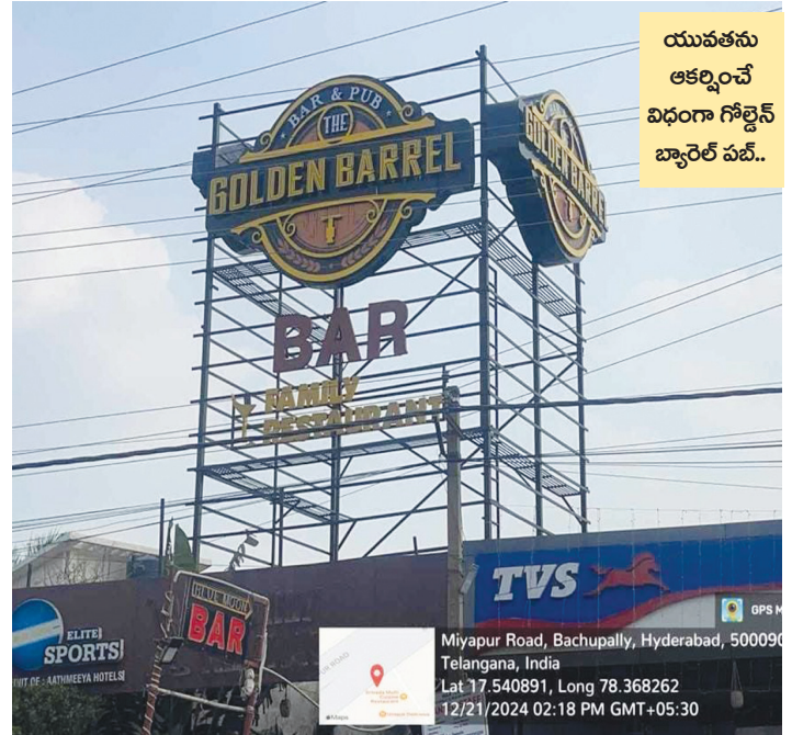
యువతను ఆకర్షించే విధంగా గోల్డెన్ బ్యారెల్ పబ్..