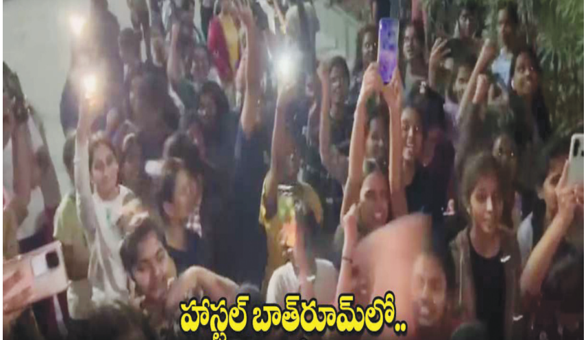
హాస్టల్ బాత్ రూమ్ లో..