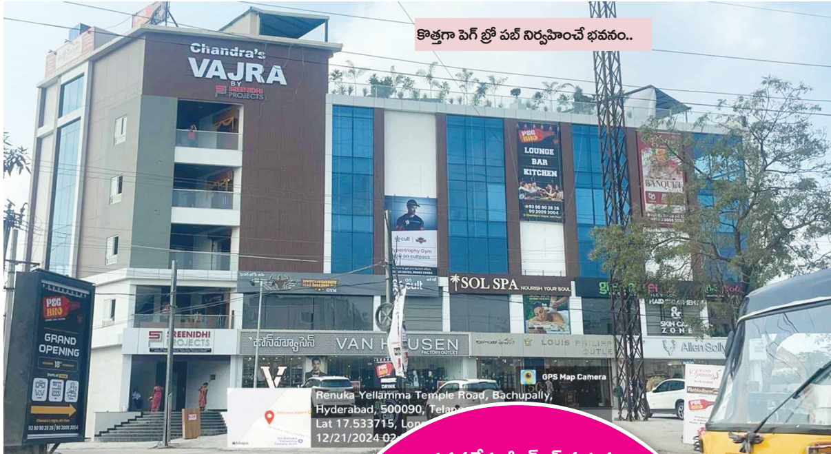
కొత్తగా పెన్ బ్రో పబ్ నిర్వహించే భవనం..