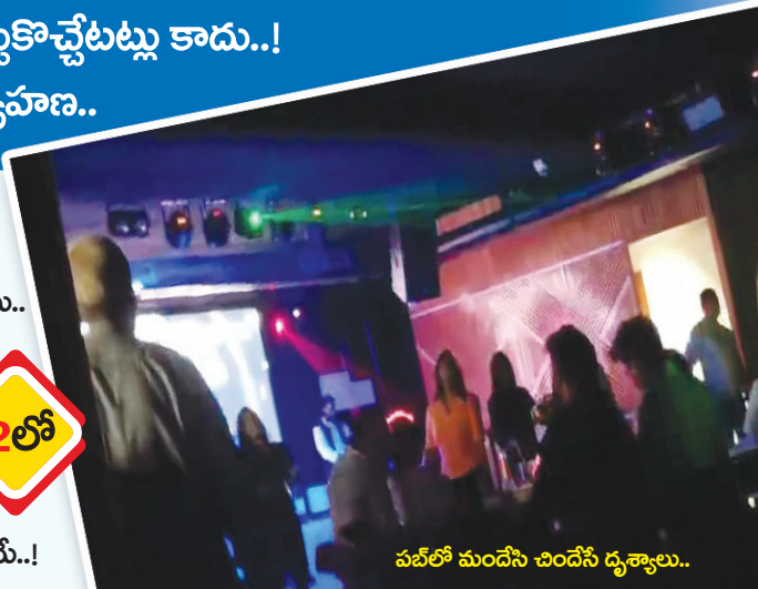
పబ్లో మందేసి చిందేసి దృశ్యాలు..