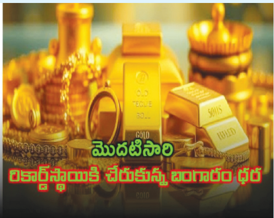
మొదటిసారి రికార్డ్ స్థాయికి చేరుకున్న బంగారం ధర

హైదరాబాద్ పెన్ పవర్: బంగారం ధర పరుగు పెడుతోంది. అంతర్జాతీయ మార్కెట్ లో అనిశ్చితి పెరిగిన నేపథ్యంలో పెట్టుబడిదారులు పసిడి వైపు చూస్తున్నారు. దీంతో బంగారం ధర భారీగా పెరిగింది. ఢిల్లీలో 10 గ్రాముల బంగారం ధర రూ.83 వేలు దాటింది. బంగారం రూ.83 వేల మార్కెట్ దాటడం ఇదే మొదటిసారి. 99.9 స్వచ్ఛత కలిగిన పది గ్రాముల బంగారం ధర ఈరోజు రూ.200 పెరిగి రూ.83,100కి చేరుకుందని ఆలిండియా సరాఫా అసోసియేషన్ తెలిపింది. 99.5 శాతం స్వచ్ఛత కలిగిన బంగారం ధర రూ.200 పెరిగి రూ.82,700కు చేరుకుంది. వెండి కిలో రూ.500 పెరిగి రూ.93,500కు చేరుకుంది. అంతర్జాతీయ మార్కెట్లో ఔస్ట్రి బంగారం ధర 2,780 డాలర్ల వద్ద కొనసాగుతోంది. వెండి 31.32 డాలర్ల వద్ద ట్రేడ్ అవుతోంది.