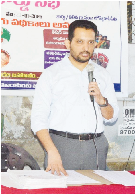
మేడ్చల్ జిల్లా కలెక్టర్ గౌతమ్ పోతు..

ప్రభుత్వ పథకాలు నిరంతర ప్రక్రియ..భయాందోళన చెందవద్దు:కలెక్టర్ గౌతమ్..