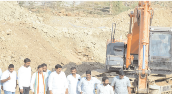
నాయకులు, విలేకరులు, యువజన నాయకులు కార్యకర్తలు తదితరులు పాల్గొన్నారు