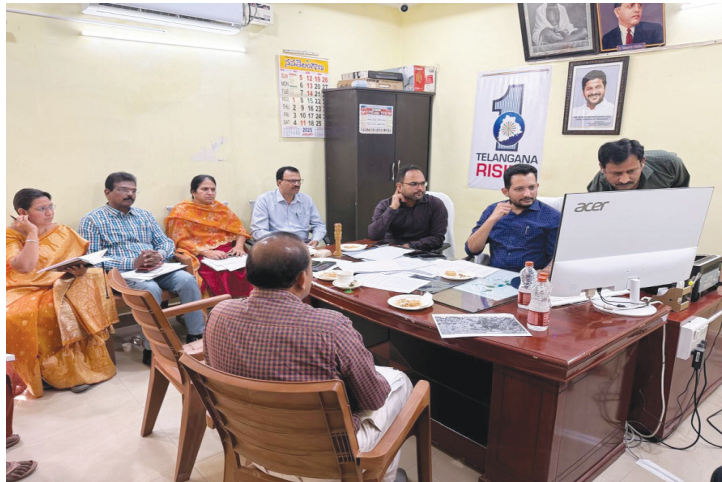
షామీర్‌పేట్ తహశీల్దార్ కార్యాలయంలో సైషల్ ఆఫీసర్ సమీక్షా సమావేశం..