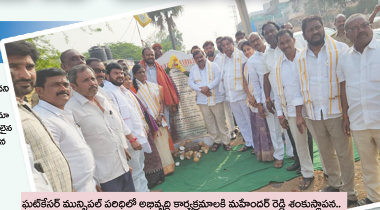
ఘట్టేసర్ మున్సిపల్ పరిధిలో అభివృద్ధి కార్యక్రమాలకు మహేందర్ రెడ్డి శంకుస్థాపన..

కార్యక్రమాలను ప్రవేశపెడుతుందని అన్నారు. ముఖ్యమంత్రి రేవంత్ రెడ్డి అమలుపరుస్తున్న 6 గ్యారంటీలు దేశంలో ఎక్కడ లేవని చెప్పారు. జనవరి 26 నుండి రైతు భరోసా అందిస్తున్నట్లు వెల్లడించారు. గ్రామీణ ప్రాంతాలతో పాటు పట్టణ ప్రాంతాలలోనూ మౌలిక సదుపాయాలను కల్పించేందుకు, ప్రభుత్వం ఎన్ని నిధులైన విడుదల చేస్తుందని మహేందర్ రెడ్డి అన్నారు. ప్రభుత్వం చేపట్టిన అభివృద్ధి, సంక్షేమ పథకాలను ప్రజలు సద్దినయోగం చేసుకొని రాష్ట్రాన్ని ప్రగతి పథంలో నడిపించాలని అన్నారు. ఘట్టేసర్ లో త్వరలో మరిన్ని నిధులతో మరికొన్ని అభివృద్ధి కార్యక్రమాలకు త్వరలో శ్రీకారం చుట్టనున్నట్లు మహేందర్ రెడ్డి వెల్లడించారు