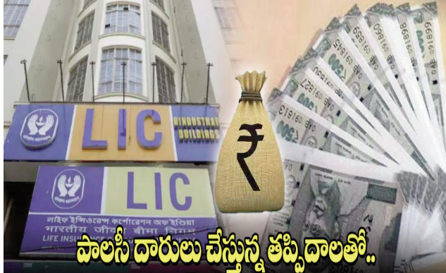
పాలసీ దారులు చేస్తున్న తప్పిదాలతో..

హైదరాబాద్ పెన్ పవర్: ప్రస్తుతం ఉన్న బిజీ ప్రపంచంలో జీవిత బీమా అనేది తప్పని సరి అయ్యింది. ఎప్పుడు ఏ ప్రమాదం వస్తుందో ఎవరూ ఊహించలేని పరిస్థితి. అందుకే కుటుంబ పెద్దకు ఏదైనా జరిగినా తనను నమ్ముకొని ఉన్న కుటుంబ సభ్యులకు అండగా ఉండేందుకు అందరూ టర్మ్ ఇన్సూరెన్స్ (వార్షిక బీమా), లైఫ్ ఇన్సూరెన్స్ (జీవిత బీమా)లు తీసుకుంటుంటారు. అయితే పాలసీ తీసుకునే సమయంలో అవగాహన లోపంతో చేసే చిన్న పొరపాట్ల వలన ఆ కుటుంబానికి రావాల్సిన మొత్తం కొన్ని సార్లు రాకుండా పోతుంది. మెచ్చూరిటి అయినా కూడా నామినీ విషయంలో చేసిన పొరపాట్ల కారణంగా ఆ మొత్తం సెటిల్ మెంట్ కాకపోవడంతో కంపెనీల అకౌంట్లలోనే ఉండిపోతుంది.