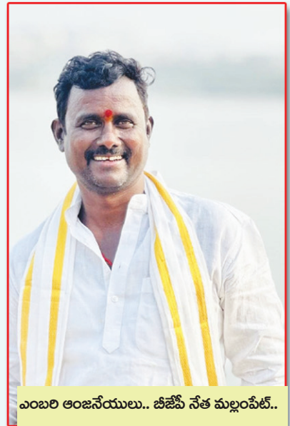
ఎంబరి ఆంజనేయులు.. బీజేపీ నేత మల్లంపేట్..