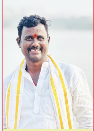
ఎంబరి ఆంజనేయులు.. బీజేపీ నేత మల్లంపేట్..