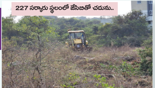
227 సర్కారు స్థలంలో జేసిబితో చదును..

బహుదూర్పల్లి సర్వే నెంబర్ 227 ప్రభుత్వ భూమి మొత్తం 353.35 ఎకరాలు ఉన్నట్లు రెవెన్యూ అధికారులు అధికారికంగా చెప్పిన సమాచారమే.. అయితే బౌరంపేట్ వెళ్ళే దారిలో ఉన్న 227 ప్రభుత్వ భూమిలో..! గత మూడు రోజులుగా, జేసిబితో చెట్లను, పొదలను తొలగించి, పెద్ద పెద్ద బండ రాళ్ళను చదును చేస్తున్నారు.. ఈవిషయంపై “పెన్ పవర్” ప్రతినిధికి అందిన సమాచారంతో ఆరాతీయగా..! ఒక జేసిబితో యధేచ్ఛగా పనులు చేయడం గమనార్హం.. స్థానికుల సమాచారంతో జిల్లా అడిషనల్ కలెక్టర్ విజయేందర్ రెడ్డి, మల్కాజిగిరి ఆర్డీవో శ్యామ్ ప్రకాష్ కు ఫోటో, వీడియో ఆధారాలతో సమాచారాన్ని చేరవేయగా సంబంధిత దుండిగల్ తహశీల్దార్ కు చర్యలకు ఆదేశించినట్లు ఆర్డీవో శ్యామ్ ప్రకాష్ పెన్ పవర్ ప్రతినిధితో తెలిపారు.. త్వరలో గాగిల్లూపూర్ సర్వే నెంబర్ 214 ప్రభుత్వ భూమిలో కబ్జాను..! బహుదూర్పల్లి సర్వే నెంబర్ 227 లో జేసిబితో చదును చేసిన స్థలాన్ని సందర్శించి పరిశీలిస్తానని ఆర్డీవో శ్యామ్ ప్రకాష్ తెలిపారు.