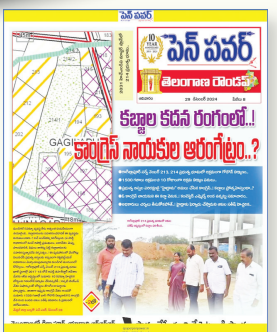
గాగిల్లాపూర్ 214 ప్రభుత్వ స్థలం కబ్బాపై ఆకుల సతీష్ ఫిర్యాదు వార్త..