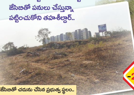
జేసిబిలతో చదును చేసిన ప్రభుత్వ స్థలం..

బహుదూర్ పల్లి సర్వే నెం.227 ప్రభుత్వ భూమిలో జేసిబిలతో పనులు..