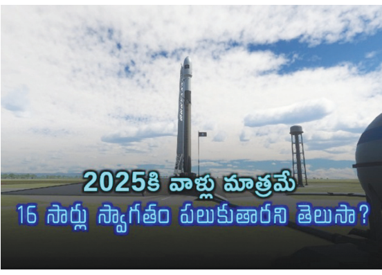
అంతరిక్షంలో ఇంటర్నేషనల్ స్పేస్ స్టేషన్ గంటకు 28 వేల కిలోమీటర్లు తిరుగుతుంది. సూర్యోదయాన్ని, ప్రతి 45 నిమిషాలకు ఒకసారి సూర్యాస్తమయాన్ని చూస్తారు.

హైదరాబాద్ పెన్ పవర్: ప్రపంచ దేశాలు 2025 కొత్త ఏడాదికి స్వాగతం పలుకుతున్నాయి! అన్నింటికంటే ముందు పసిఫిక్ మహాసముద్రంలోని కిరిబాటి దీవులు 2025కి స్వాగతం పలికాయి. భానుడి కిరణాలు మొదట పడే పసిఫిక్ మహా సముద్ర ప్రాంత దేశాలు మొదట కొత్త ఏడాది సంబరాలు జరుపుకుంటాయి. ఆఖరున హౌలాండ్ వంటి దీవులు కొత్త ఏడాదికి స్వాగతం పలుకుతాయి. ఒక్కో దేశం ఒక్కోసారి కొత్త సంవత్సరానికి స్వాగతం పలుకుతాయి. ప్రపంచ దేశాల్లోని ప్రజలు 2025కు ఒకేసారి స్వాగతం పలకగలుగుతారు! కానీ వ్యోమగాములు మాత్రం 16 సార్లు కొత్త ఏడాదికి స్వాగతం పలుకుతారు.