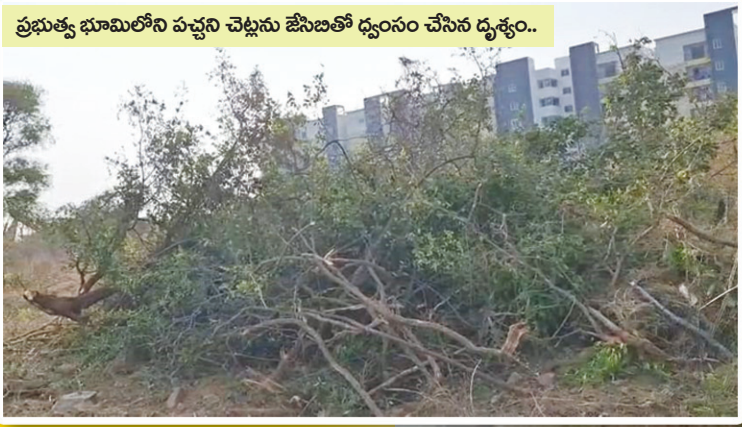
ప్రభుత్వ భూమిలోని పచ్చని చెట్లను జేసిబతో ధ్వంసం చేసిన దృశ్యం..