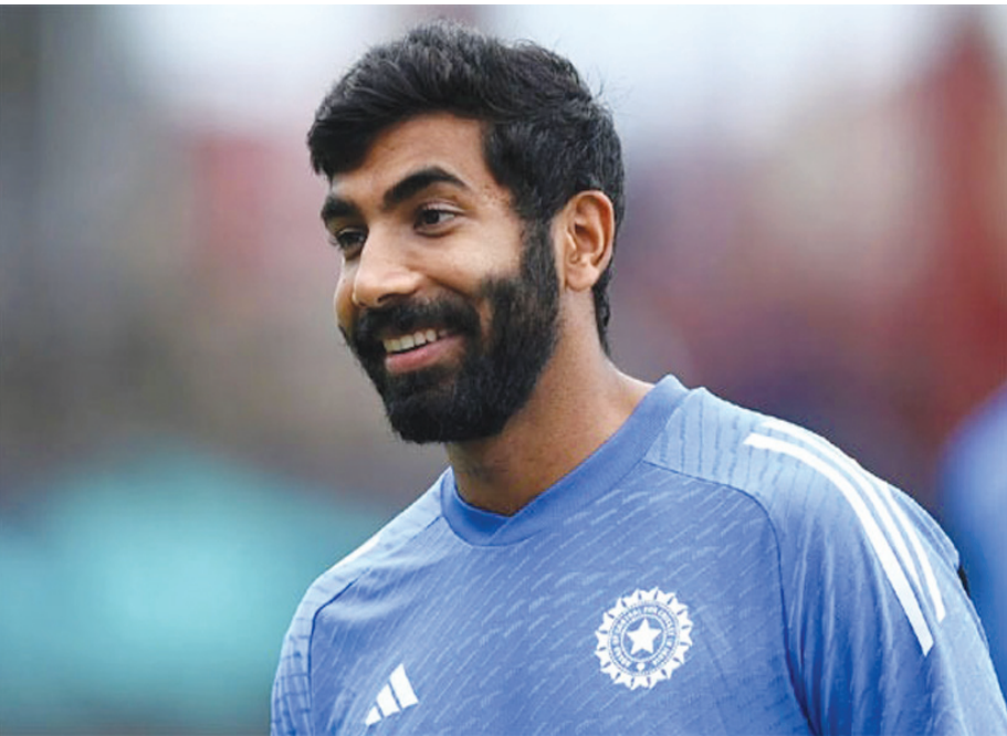
హైదరాబాద్ పెన్ పవర్: వెస్ట్ ఇండీస్ తో బాధపడుతున్న టీమిండియా స్టార్ పేసర్ జస్టిన్ బువ్రా ఫిబ్రవరి 19 నుంచి ప్రారంభమయ్యే ఐసీసీ ఛాంపియన్స్ ట్రోఫీని దృష్టిలో ఉంచుకుని, ఇంగ్లండ్ తో స్వదేశంలో జరిగే వైట్-బాల్ సిరీస్ లో విశ్రాంతి తీసుకునే అవకాశం ఉందని సమాచారం. జనవరి 22 నుంచి భారత్ ఐదు టీ20లు, మూడు

వన్డేల్లో ఇంగ్లండ్ తో తలపడనుంది. ఇక తాజాగా ముగిసిన బోర్డర్-గవాస్కర్ ట్రోఫీ (బీజీటీ) సిరీస్ లో బువ్రా అద్భుతంగా రాణించిన విషయం తెలిసిందే. ఈ సిరీస్ ను భారత్ కోల్పోయినప్పటికీ ఈ స్టార్ పేసర్ 32 వికెట్లతో ఫ్లేయర్ ఆఫ్ ది సిరీస్ గా నిలిచాడు. ఇక 30 వికెట్ల బువ్రా ఈ సిరీస్ లో మొత్తం 150 ఓవర్లకు పైగా బౌలింగ్ చేయడం విశేషం. కాగా, బువ్రా వెస్ట్ ఇండీస్ పై గాయం తీవ్రతపై ఇంకా స్పష్టత రాలేదు. దాంతో గ్రేడ్ ఇంకా నిర్ణయించలేదు. బువ్రా గాయం గ్రేడ్ 1 తేటగిరిలో ఉంటే, రిటర్న్ టు ఫ్లీ (ఆరీటీపీ) కి ముందు కనీసం రెండు నుంచి మూడు వారాల విశ్రాంతి అవసరం అవుతుంది. అలాగే గ్రేడ్ 2 గాయం విషయంలో రికవరీకి ఆరు వారాల వరకు సమయం పడుతుంది. కానీ, గ్రేడ్ 3 గాయం విషయంలో మాత్రం కనీసం మూడు నెలల విశ్రాంతి, పునరావాస కార్యక్రమాలు అవసరమవుతాయి. గాయం కాకపోయినా ఉన్నా బువ్రా స్వదేశంలో ఇంగ్లండ్ తో జరిగే టీ20 టైప్ టెస్ట్ సిరీస్ కు దూరంగా ఉండేవాడు. కానీ, ఛాంపియన్స్ ట్రోఫీ దృష్ట్యా అతను కచ్చితంగా ఇంగ్లండ్ తో 50 ఓవర్ల ఫౌర్ డేస్ లో మూడు వన్డేలు ఆడేవాడు. అయితే, ఇప్పుడు గాయం కారణంగా ఇందులో (వన్డే సిరీస్) ఆడడం అనుమానంగా మారింది. బువ్రా ఒకవేళ గాయం నుంచి కోలుకుంటే తన ఫిట్ నెస్ ను చెక్ చేసుకోవడానికి ఫిబ్రవరి 12న అహ్మదాబాద్ లోని తన హోమ్ గ్రౌండ్ లో ఇంగ్లండ్ తో జరిగే వన్డేలో బరిలోకి దిగుతాడా లేదా అనేది తెలియాల్సి ఉంది. ఇక భారత్ తమ ఛాంపియన్స్ ట్రోఫీ ప్రయాణాన్ని ఫిబ్రవరి 20న దుబాయ్ లో బంగ్లాదేశ్ తో జరిగే తొలి మ్యాచ్ తో ప్రారంభించనుంది.