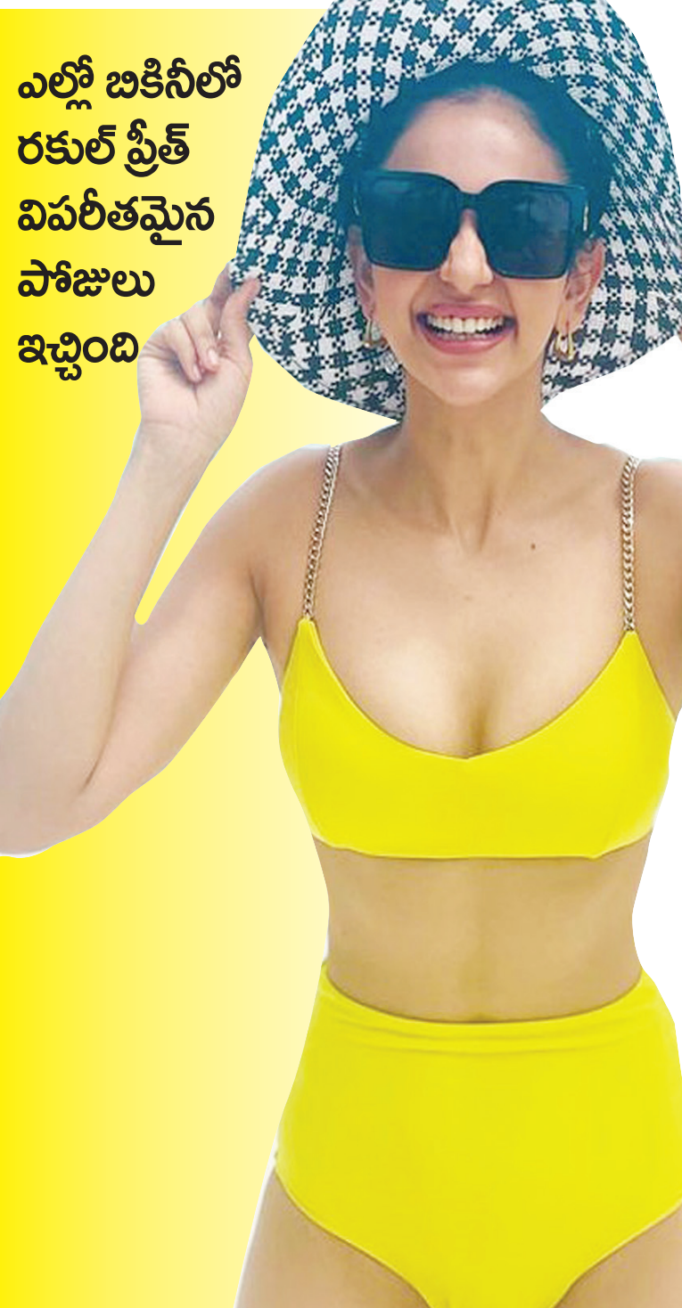
ఎల్లో బకినీలో రకుల్ ప్రీత్ విపరీతమైన పోజులు ఇచ్చింది

ప్రస్తుతం ఇండస్ట్రీలో పెళ్లైన భామలకు గిరాకీ గురించి తెలిసిందే. పెళ్లి, ప్రసవంతో సంబంధం లేకుండా హీరోయిన్లు అవకాశాలు అందుకుంటున్నారు. ఇంకా చెప్పాలంటే పెళ్లైన భామలకు ఇచ్చిన ప్రాధాన్యత పెళ్లికాని భామలకు ఇవ్వడం లేదు. బాలీవుడ్, టాలీవుడ్, కోలీవుడ్ ఇలా అన్ని భాషల్లోనూ మూడు ముళ్లు వేయించుకున్న భామలదే అగ్రస్థానం. అయితే ఐశ్వర్యా