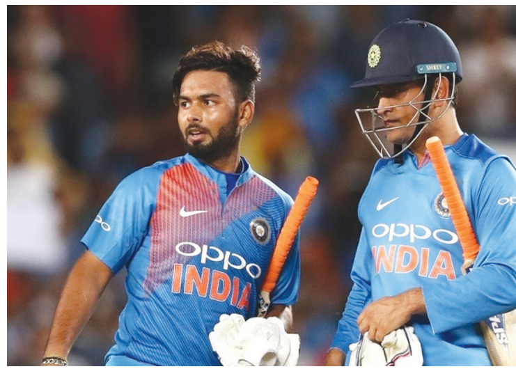
స్టంపింగ్స్ చేశాడు. రిషభ్ పంత్.. 43 టెస్టుల్లో 149 క్యూవీలు, 15 స్టంపింగ్స్. 31 వన్డేల్లో 27 క్యూవీలు, ఒక స్టంపింగ్. 76 టీ20ల్లో 38 క్యూవీలు, 11 స్టంపింగ్స్ చేశాడు.

గణాంకాలలో ఎవరు ఎలా.. ధోనీ.. టెస్టుల్లో 90 మ్యాచ్లు ఆడి 256 క్యూవీలు, 38 స్టంపింగ్స్ చేశాడు. వన్డేల్లో 350 మ్యాచ్ లలో 321 క్యూవీలు, 123 స్టంపింగ్లు, 98 టీ20లలో 57 క్యూవీలు, 34