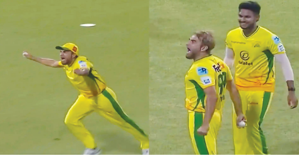
జయింట్స్ పై జోబర్ల సూపర్ కింగ్స్ 28 పరుగుల తేడాతో విజయం సాధించింది. మొదట బ్యాటింగ్ చేసిన సూపర్ కింగ్స్ నిర్ణీత 20 ఓవర్లలో 7 వికెట్ల నష్టానికి 169 పరుగులు చేసింది. లక్ష్య చేదనలో సూపర్ జయింట్స్ 141 పరుగులకే పరిమితమైంది.

హైదరాబాద్ పెన్ పవర్: సౌత్ ఆఫ్రికా మాజీ స్పిన్నర్ ఇస్మాన్ తాహిర్ కు వయసు కేవలం నెంబర్ మాత్రమే. 45 ఏళ్ళ వయసులోనూ తన స్పిన్ మాయాజాలంతో సత్తా చాటుతూ క్రికెట్ లో కొనసాగుతున్నాడు. స్పిన్ బౌలింగ్ తో పాటు మైదానంలో తన సెలెబ్రేషన్ తో ఈ సఫారీ స్పిన్నర్ బాగా వైరల్ అవుతాడు. సౌత్ ఆఫ్రికా టీ20 లీగ్ లో అతను ఫుట్ బాల్ దిగ్గజం క్రిస్టియానో సెలెబ్రేషన్ తో అందరి దృష్టి ఆకర్షించాడు. అద్భుతమైన క్యాచ్ అందుకుంటూ ప్రేక్షకులను ఆశ్చర్యానికి గురి చేశాడు. సూపర్ జయింట్స్ ఛేజింగ్ చేస్తున్న సమయంలో ఇన్నింగ్స్ 7వ ఓవర్ లో ఈ ఫుటన చోటుచేసుకుంది. 2 వికెట్ల నష్టానికి 51 పరుగులు చేసిన సూపర్ జయింట్స్ లక్ష్యం దిశగా వెళ్తుంది. ఈ దశలో నమ్మశక్యం కాని క్యాచ్ తో తాహిర్ ఆ జట్టుకు పాకిచ్చాడు. ఇన్నింగ్స్ ఏడో ఓవర్ లో డోనోవన్ ఫెరీరా వేసిన మూడో బంతిని మల్లర్ రివర్స్ స్ట్రైక్ చేశాడు. అక్కడే పాయింట్ వద్ద ఫీల్డింగ్ చేస్తున్న తాహిర్ డైవింగ్ చేసి క్యాచ్ అందుకున్నాడు. క్యాచ్ అనంతరం గ్రౌండ్ మొత్తం తిరుగుతూ రోనాల్డో సెలెబ్రేషన్ చేసుకోవడం హైలెట్ గా మారింది. తాహిర్ సూపర్ క్యాచ్ తో మల్లర్ 9 పరుగులకే పెవిలియన్ కు చేరాల్సి వచ్చింది. ఈ క్యాచ్ తో మ్యాచ్ సూపర్ కింగ్స్ వైపుకు మళ్లింది. వయసు పెరిగినా తాహిర్ ఎనర్జీ అలాగే ఉండని నెట్ బిట్స్ కామెంట్స్ చేస్తున్నారు. ఈ మ్యాచ్ విషయానికి వస్తే డర్బన్ సూపర్