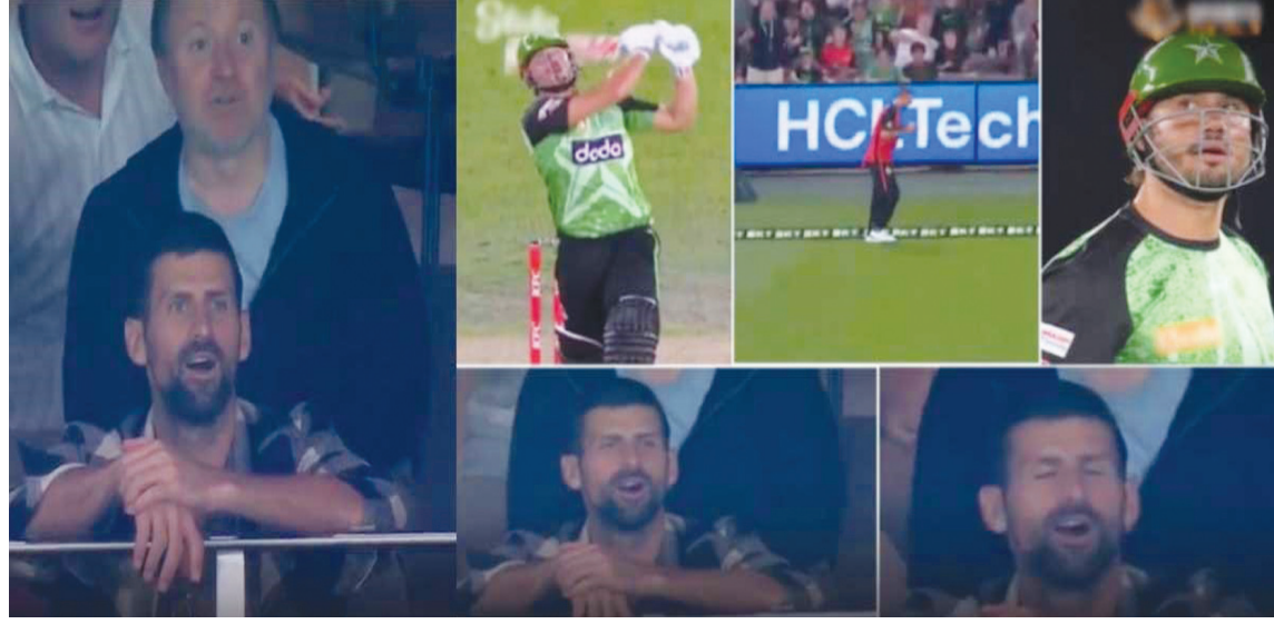
చేరుకున్నాడు. సోమవారం అతని మ్యాచ్ ప్రారంభం కానుండగా ఒక రోజు ముందు ఆదివారం సరదాగా మ్యాచ్ చూడడానికి గ్రౌండ్ కు వచ్చాడు. కెరీర్ లో ఇప్పటివరకు 24 గ్రౌండ్ స్టామ్స్ గెలిచి అత్యధిక టైటిల్స్ గెలుచుకున్న అటగాళ్లలో అగ్ర స్థానంలో కొనసాగుతున్నాడు. 25 వ గ్రౌండ్ స్టామ్ టైటిల్ గెలిచి చరిత్ర సృష్టించాలని ఆరాటపడుతున్నాడు. గత ఏడాది ఆసిస్ బ్యాటర్ స్టీవ్ స్మిత్.. జోకోవిచ్ తో సరదాగా టెన్సిస్ మ్యాచ్ ఆడి సందడి చేశాడు.