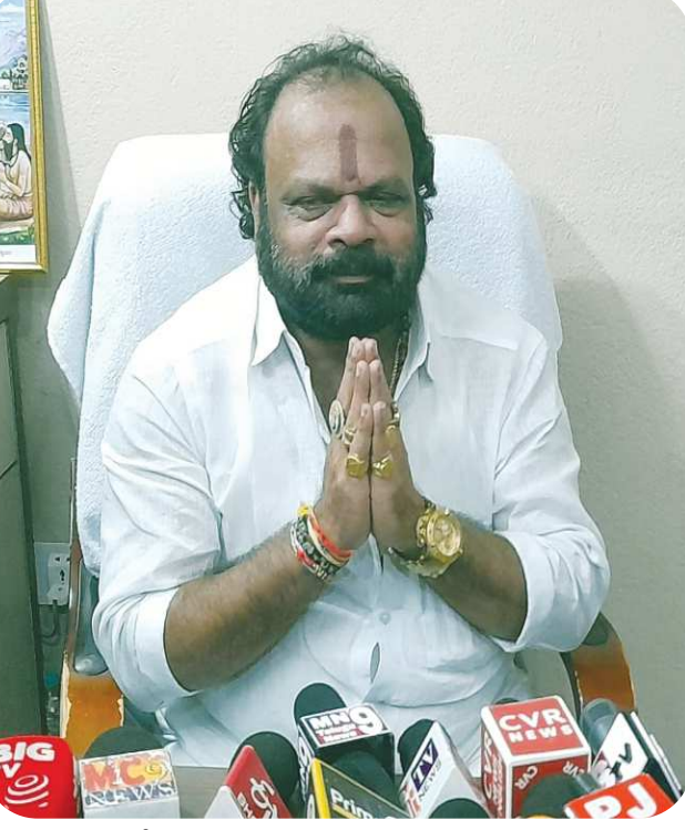
పలమనేరు జనవరి 15, (పెన్ పవర్)

ఆంధ్రప్రదేశ్ రాష్ట్రంలో జరిగిన సార్వత్రిక ఎన్నికల ఫలితాల్లో వైసీపీ ఘోరంగా ఓటమి పాలైన సంగతి తెలిసిందే. ఈ నేపథ్యంలో ఆపార్టీకి కొంతమంది సీనియర్ నేతలు రాజీనామా చేసి ఇతర పార్టీలోకి చేరిపోగా, మరి కొంతమంది నేతలు స్వబ్ధంగా ఉండిపోయారు. తాజాగా బుధవారం పలమనేరు