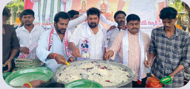
శ్రీ కాళహస్తి - పెన్ పవర్, జనవరి 15