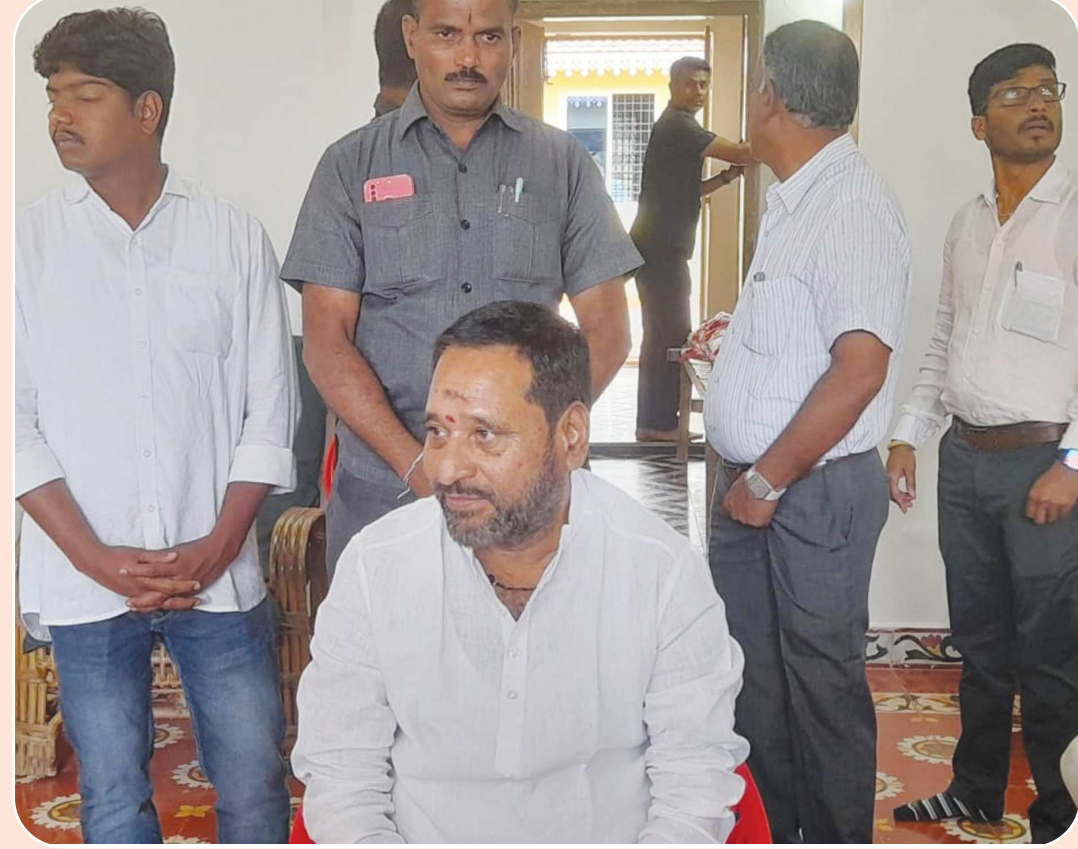
పలమనేరు జనవరి 15 (పెన్ పవర్)

ఆరు నెలలలో జరిగిన అభివృద్ధిపై మీడియా ఆత్యయ సమావేశంలో వివరించిన ఎమ్మెల్యే