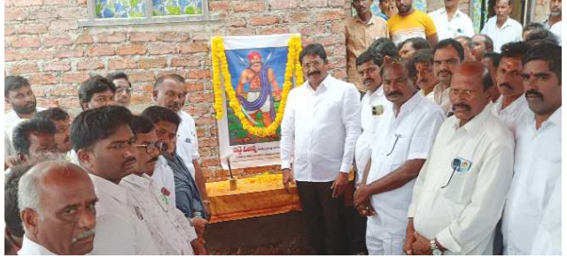
గడ్డిలూరు పెన్ పవర్ జనవరి 11