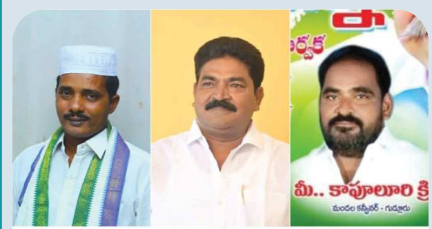
కందుకూరు నియోజకవర్గం YSRCP మండల పార్టీ అధ్యక్షులు