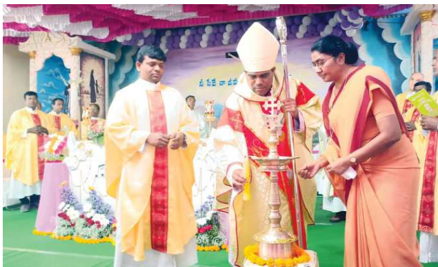
దోసకొండ జనవరి 11 పెన్ పవర్