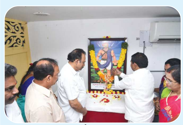
స్టాఫ్ రిపోర్టర్ ఒంగోలు, పెన్ పవర్ జనవరి 11