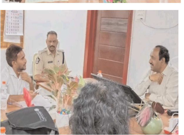
చీరాల, పేన్ పవర్, జనవరి 25