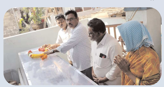
లింగసముద్రం పేన్ పవర్, జనవరి 25: