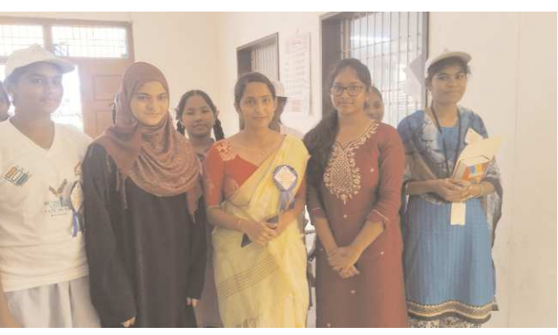
కందుకూరు పేన్ పవర్ జనవరి 25