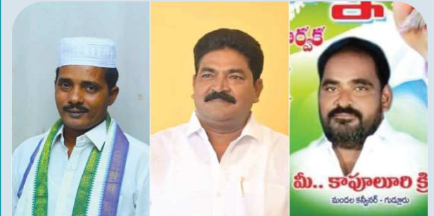
కందుకూరు నియోజకవర్గం YSRCP మండల పార్టీ అధ్యక్షులు