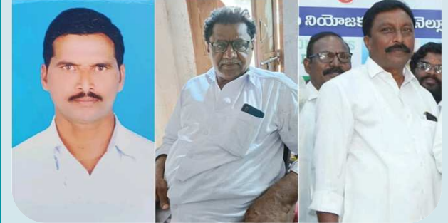
కందుకూరు పెన్ పవర్, జనవరి 11