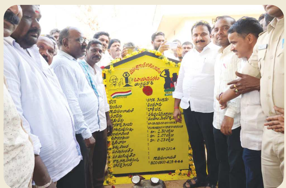
ఉలపాడు పెన్ పవర్, జనవరి 11