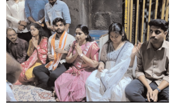
కుటుంబ సభ్యులతో దర్శించుకున్న హెంజులపల్లి వంగలపూడి అనిత

సీంహాచలం, పెన్ పవర్, జనవరి 20 : విశాఖ జిల్లా, సీంహాచలం శ్రీ వరాహలక్ష్మీ నరసింహస్వామివారిని కుటుంబ సభ్యులతో కలిసి హెంజులపల్లి వంగలపూడి అనిత దర్శించుకున్నారు. ఈ సందర్భంగా ఆలయ ముఖ్యధికారి హెంజులపల్లి అధికారులు స్వాగతం పలికారు. కవుస్తంభం ఆలయం స్వామివారి దర్శనం అనంతరం అనితకు పందితులు వేద ఆశీర్వాచనం ఇవ్వగా, స్వామివారి చిత్రపటాన్ని ప్రసాదాన్ని అధికారులు అందజేశారు. ఈ సందర్భంగా మంత్రి అనిత మాట్లాడుతూ తెలుగు ప్రజలకు అప్పన్నస్వామి వారి అనుగ్రహం ఉండాలని స్వామివారిని