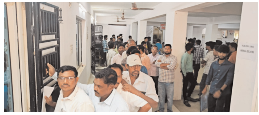
● వీఆర్ఎస్ కు 68 వినతులు ● కెఆర్ఎస్ ప్రత్యేక ఉప కలెక్టర్ పి.ధర్మచంద్రారెడ్డి

కురుపాం / పార్వతీపురం, పెన్ పవర్, జనవరి 20 : ప్రజా సమస్యల పరిష్కార వేదిక(పీఐఆర్ఎస్) కార్యక్రమానికి 68 వినతులు వచ్చాయని, వాటిపై తక్షణ చర్యలు తీసుకోవాలని కెఆర్ఎస్ ప్రత్యేక ఉప కలెక్టర్ పి.ధర్మచంద్రారెడ్డి జిల్లా అధికారులను కోరారు. సోమవారం కలెక్టర్ కార్యాలయ సమావేశ మందిరంలో జరిగిన పీఐఆర్ఎస్ కార్యక్రమంలో ప్రత్యేక ఉప కలెక్టర్ పాల్గొని అధికారుల నుంచి వినతులను స్వీకరించారు. వచ్చిన అర్జీలను ఆయా శాఖాధికారులు పరిశీలించి శాశ్వత పరిష్కారానికి చర్యలు తీసుకోవాలని జిల్లా అధికారులకు తెలిపారు. పరిష్కారమైన అర్జీలతో అధికారులకు సంకల్పిత చెందాలని, అర్జీలు పునఃప్రారంభం కాకుండా చూడాలని అన్నారు. ఈ కార్యక్రమంలో అందిన కొన్ని అర్జీల వివరాలు ఈ విధంగా ఉన్నాయి.