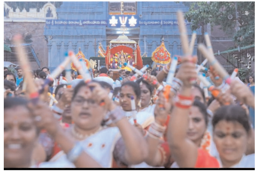
సింహాచలం, పెన్ పవర్, జనవరి 12 : ప్రముఖ పుణ్యక్షేత్రం శ్రీ వరహలక్ష్మీస్వామి స్వామివారి దేవస్థానం, సింహాచలం అప్పన్న మహిమాన్వితం దేశంలోనే ప్రముఖ పుణ్యక్షేత్రంగా విరాజిల్లుతున్న ఆలయంలో అంగరంగ వైభవంగా శ్రీ స్వామివారి ధారోత్సవాలు జరిగాయి. సింహగిరి పై లిధారోత్సవాలు ఐదు రోజులపాటు జరిగే