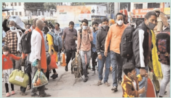
స్టాఫ్ రిపోర్టర్, పెన్ పవర్, విశాఖపట్నం జనవరి 12. :సంక్రాంతి పండుగ రద్దీ వేళ ట్రావెల్స్ అడ్డగోలు దోపిడీ ప్రారంభించింది.

పట్టణం వల్లెబాట పట్టి. ఉపాధి ఉద్యోగాల కోసం హైదరాబాద్, విజయ వాడ, విశాఖపట్నం వంటి నగరాల నుంచి స్వ స్థలాలకు వెళ్తున్నారు. ఇదే సమయం అదనుగా చేసుకుని ప్రైవేట్ ట్రావెల్స్ అడ్డగోలు దోపిడీకి తెరలేపారు. సాధారణ రోజుల్లో హైదరాబాద్ నుంచి ఇతర ప్రాంతాలకు వెళ్లే ట్రావెల్స్ బస్సుల్లో టిక్కెట్ ధర రూ.500 నుంచి రూ.2000 వరకు ఉండేది. సంక్రాంతి పండుగ అడ్డపెట్టుకుని ఏకంగా తక్కువలో తక్కువ రూ.1000 నుంచి రూ.6 వేలకు పైగా వసూలు చేసి సామాన్యుల సర్ది విరుస్తున్నారు ఎంత జరుగుతున్న ఆర్టీసీ అధికారులు తమకేమీ పట్టలేనట్లు చోర్యం చూస్తున్నారు అని పండగకు తమ సొంత ఊర్ల కు ప్రయాణించే ప్రయాణికులు ఆరోపిస్తున్నారు.