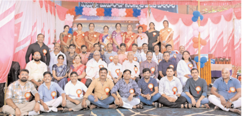
అయిన సందర్భంగా ఈ ఆత్మీయ తమ యొక్క తీపి జ్ఞాపకాలను గుర్తు చేసుకొని వారి అనుభవాలు ను తెలయజేసుకున్నారు. వారికి చదువు చెప్పి పాఠాలు నేర్పించి ఎంతో ప్రయోజనాలను చేసిన ఉపాధ్యాయులును ఈ ఆత్మీయ సమ్మేళన కార్యక్రమానికి గౌరవంగా అహ్వానించి కాలువా లు, పూల మొక్కలు జ్ఞాపికలు తో సత్కరించారు. మార్చి 2000 లో చదువుకున్న ఈ