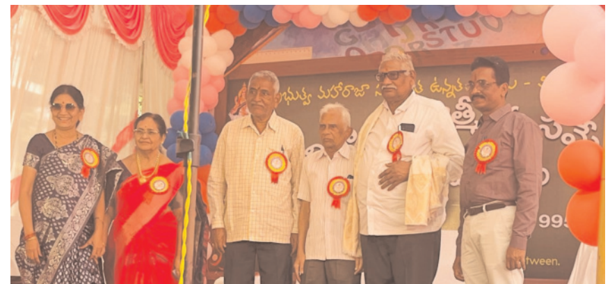
మహా రాజ సంస్కృత ఉన్నత పాఠశాలలో మార్చి 2000 బ్యాచ్ విజయనగరం క్రైమ్ జ్యూర్, పెన్ పవర్, జనవరి 12 : విజయనగరం పట్టణంలో గల ప్రభుత్వ మహా రాజ సంస్కృత ఉన్నత పాఠశాలలో మార్చి 2000 సంవత్సరం లో 10 వ తరగతి చదువు కున్న పూర్వ విద్యార్థుల ఆత్మీయ సమ్మేళనం కార్యక్రమం ఆదివారం నాడు వారు చదువుకు న్న పాఠశాలలో ఘనంగా నిర్వహించారు. 10 వ తరగతి చదువుకొని 25 సంవత్సరాలు పూర్తి