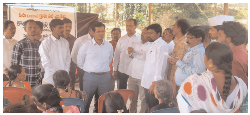
● వెనుకబడిన విద్యార్థుల పట్ల ప్రత్యేక శ్రద్ధ ● పేసా గ్రామ సభ ఎన్నికలు పాఠదర్శకంగా జరపండి.