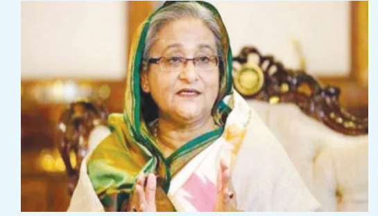
పెన్ పవర్ డెప్యూటీ ప్రధాని పలువురి అభ్యుత్సం, హత్యలకు సంబంధించి ఆ దేశ మాజీ ప్రధాని షేక్ హసీనాపై బంగ్లాదేశ్ కోర్టు ఇంటర్నేషనల్ క్రైమ్స్ ట్రిబ్యూనల్ (ఐసీటీ) ఈరోజు మరో వారెంట్ జారీ చేసింది. ఇందులో