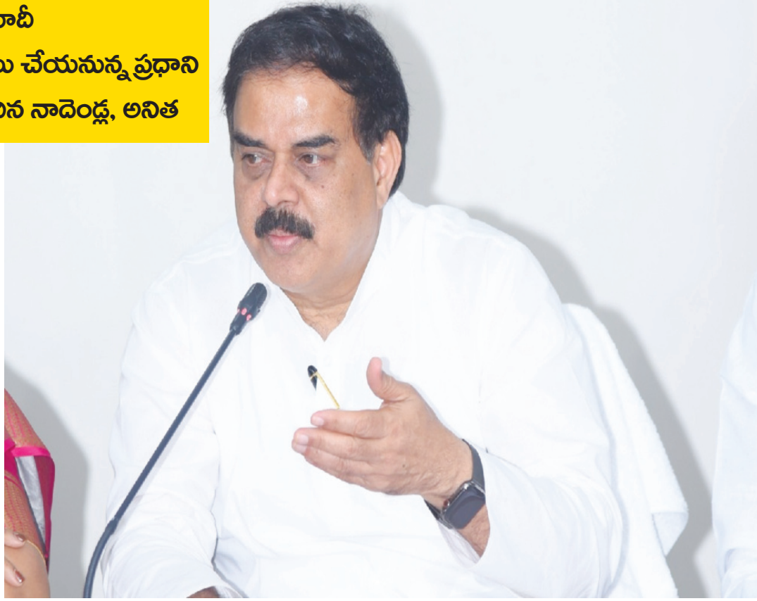
నుంచి వచ్చే వాహనాలు ట్రాఫిక్ నియంత్రణపై ముందస్తు చీసుకోవాలని, అధికారులు, సిబ్బంది సమన్వయంతో ప్రజలకు ప్రణాళిక తయారు చేసుకోవాలని, రూల్స్ మ్యాన్ తయారు ఇబ్బందులు కలుగకుండా చర్యలు తీసుకోవాలని తెలిపారు.

పెన్ పవర్ డెప్యూటీ ప్రధాని సరేంద్ర మోదీ ఈ నెల 8న విశాఖ పర్యటనకు వస్తుండడం తెలిసింది. పలు అభివృద్ధి పనులకు శంకుస్థాపనలు, ప్రారంభోత్సవాలు చేయనున్నారు. ఈ నేపథ్యంలో, మోదీ పర్యటనకు సంబంధించిన ఏర్పాట్లను ఆహార మరియు పౌర సరఫరాల శాఖ మంత్రి నాదెండ్ల మనోహర్, హోం మరియు విపత్తుల నిర్వహణ శాఖ మంత్రి వంగలపూడి అనిత సమీక్ష చేపట్టారు. జిల్లా కలెక్టర్ కార్యాలయంలో సోమవారం మధ్యాహ్నం అధికారులతో సమావేశం నిర్వహించారు. మంత్రి నాదెండ్ల మనోహర్ మాట్లాడుతూ, ప్రధానమంత్రి పర్యటన ఏర్పాట్లు పక్కాగా ఉండాలని అధికారులకు స్పష్టం చేశారు. బహిరంగ సభకు తీసుకువెళుతున్న ప్రతి ఒక్కరినీ మరల సురక్షితంగా వారి గ్రామంలో దించే విధంగా చర్యలు తీసుకోవాలని తెలిపారు. ఆర్డీసీ బస్సులు పర్యవేక్షణకు సంబంధించి కంట్రోల్ రూం ఏర్పాటు చేయాలని ఆర్డీసీ అధికారులను ఆదేశించారు. వాహనాల పార్కింగులో ఇబ్బందులు రాకుండా సమన్వయం చేసుకోవాలని తెలిపారు. అధికారులు, ప్రజాప్రతినిధులు, అందరి సహకారంతో మోదీ పర్యటన విజయవంతం చేద్దామన్నారు. హోం మంత్రి వంగలపూడి అనిత మాట్లాడుతూ, మండలాల ప్రణాళిక తయారు చేసుకోవాలని, రూల్స్ మ్యాన్ తయారు