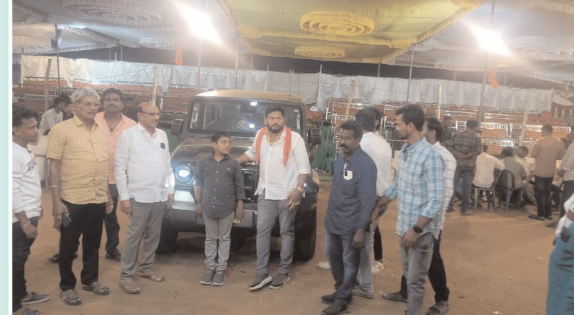
బరిలోనే ప్రాణాలు విడిచాయి.పందగ మూడు రోజులు ఇటు

పోలీసులు చేసిన హాంసా అంతా ఇంతాకాదు. చివరికి ఆ ప్రచార గొంతులు ఒక్కసారిగా మూగిపోయాయి. బరులలో పందెం కోళ్లు కత్తులు దూసాయి.యభేచ్ఛగా కోడిపందాల నిర్వహణకు వినీ స్టేడియంను తలపించే విధంగా క్రీడా మైదానాలు రాత్రికి రాతే బరులు సిద్ధం చేశారు.ప్రతి బరిలో భారీ ఎత్తున నగదు మార్పులు జరిగాయి. యభేచ్ఛగా కోడిపందాలు జరిగితే,పోలీసులు ప్రేక్షకపాత్రవహించారు. ప్రతి బరివద్ద ఇద్దరు పోలీసులు మష్టిలో ఉండటం విశేషం.పందెం రాయుళ్లు బరితెగించారు.కరవ, కాకినాడ రూరల్, పెదతాళ్ళపాలం,జగన్నాధగిరి, గొర్రెపూడి,కొంగోడు,తదితర గ్రామాల్లో నిర్వహించిన పందెం బరులలో కోళ్లకు కత్తులు కట్టి బరిలో ఉదలగానే పెరూరాహారీగా పోరాడాయి.కరవ మండల పరిధిలోని కొరవల్లిలో నిర్వహించిన పందేలు చూసేందుకు జనం పోటెత్తారు.సున్నా-నేనా అంటూ పందెం కోళ్లు కత్తులతో నాట్యం చేయడంతో పందెం రాయుళ్లు,వీక్షకుల గుండెల్లో ఉత్సాహ మొదలైంది.కొన్ని సందర్భాలలో చావు అంచులకు చేరా తగ్గదేలే! అంటూ చివరి క్షణం వరకు పోరాడి..తమ యజమానులను నెగ్గించేందుకు ఎక్కువ తగ్గేది కావు.కొన్ని వుంబలు