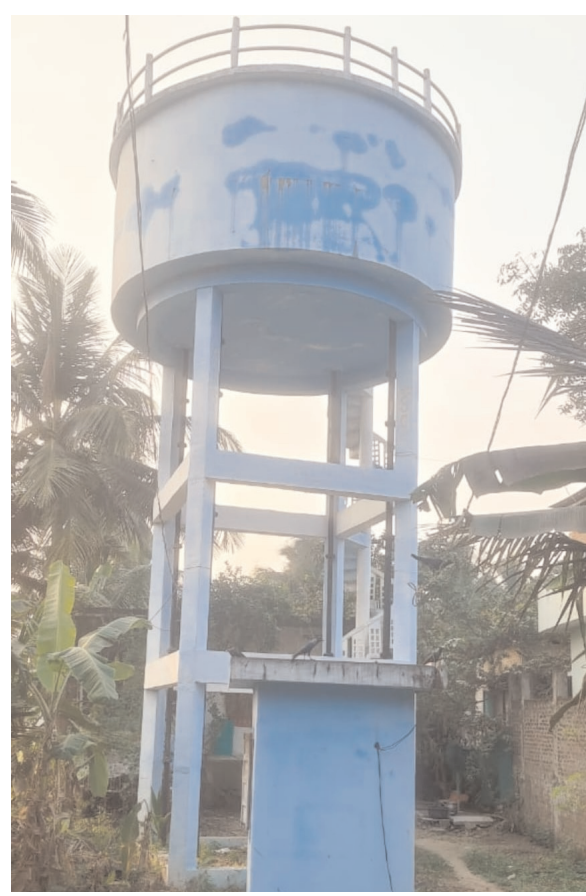
సమస్యలతో సతమతమవుతున్న ఒకటి నంబర్ వార్డు ప్రజలు

కొత్తపేట, పెన్ పవర్, జనవరి 16: డాక్టర్ బి.ఆర్ అంబేద్కర్ కోసనీమ జిల్లా కొత్తపేట గ్రామ పంచాయతీ ఒకటి నంబర్ వార్డులో ప్రజలు త్రాగునీరు కోసం తీవ్ర ఇబ్బందులు ఎదుర్కొంటున్నారు.