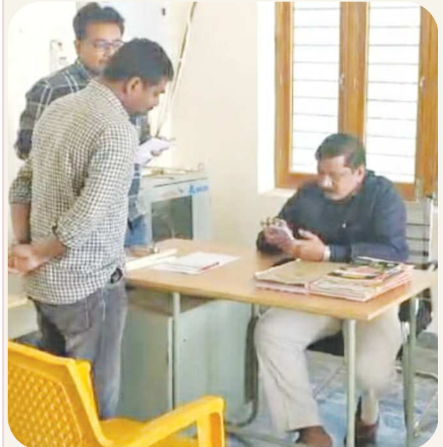
కొమరోలు పెన్ పవర్ జనవరి 7

ప్రభుత్వ ఆదేశాల మేరకు సర్వేలను సమర్థవంతంగా నిర్వహించాలని కొమరోలు ఎంపీడీవో సయ్యద్ మస్తాన్ పలి గ్రామ సచివాలయ ఉద్యోగులను ఆదేశించారు. మంగళవారం ఆయన బ్రాహ్మణపల్లి లోని గ్రామ సచివాలయాన్ని ఆకస్మికంగా సందర్శించి, రికార్డులు తనిఖీ చేశారు. ఆ సందర్భంగా సిబ్బందితో ఆయన మాట్లాడుతూ ప్రభుత్వ ఆశయాలకు అనుగుణంగా ప్రజలకు మెరుగైన సేవలు అందించాలని కోరారు. ఉద్యోగులు సమయపాలన పాటిస్తూ గ్రామ సచివాలయానికి అవసరాల కోసం వస్తున్న ప్రజలతో స్నేహపూర్వకంగా వ్యవహరిస్తూ, వారి సమస్యలను తెలుసుకొని వాటి పరిష్కారానికి కృషి చేయాలని కోరారు. రాష్ట్ర ప్రభుత్వం నిర్దేశించిన హాస్ట్ హోల్డ్ సర్వే, మిస్సింగ్ సీనియర్ సిటిజన్ సర్వేలను సమర్థవంతంగా నిర్వహించి ప్రభుత్వ ఆశయాన్ని నెరవేర్చాలని ఆయన కోరారు. ఆ కార్యక్రమంలో బ్రాహ్మణపల్లి గ్రామ శివాలయం కార్యదర్శి సిబ్బంది పాల్గొన్నారు.