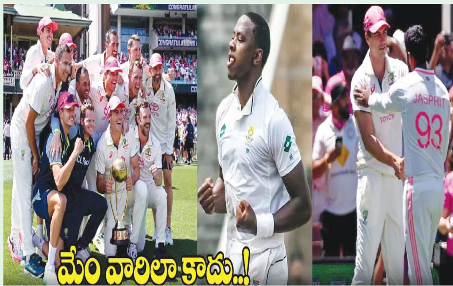
మేం వారిలా కాదు..!

హైదరాబాద్ పెన్ పవర్: పదేళ్ల తరువాత బోర్డర్-గవాస్కర్ ట్రోఫీని గెలుకున్న ఆస్ట్రేలియా.. పరుసగా రెండో సారి దక్షిణాఫ్రికా (%బొజ%) పైనల్ చేరిన విషయం తెలిసిందే. ఈ ఏడాది జూన్ లో జరిగే పైనల్లో దక్షిణాఫ్రికాతో తలపడనుంది. ఇంగ్లాండ్ లోని ఐకానిక్ లార్డ్స్ వేదికగా ఇరు జట్లు గడ కోసం పోరాడనున్నాయి. ఈ క్రమంలో కమ్మిన్స్ సేనకు సఫారీ పేసర్ రబదా హెచ్చరికలు పంపాడు. ఆస్ట్రేలియాను ఎలా ఓడించాలో తమకు బాగా తెలుసని అన్నాడు. "దక్షిణాఫ్రికా %జం% ఆస్ట్రేలియా.. ఇరు జట్ల మధ్య ఎప్పుడూ తీవ్రమైన పోటీ ఉంటుంది. మైదానంలో ఇరు జట్ల ప్లేయర్లు ఒకేలా కష్టపడతారు. మ్యూచ్ పై పైచేయి సాధించాలన్న కని ప్రతి సంధ్యల్లోనూ కనిపిస్తుంది. వారిపై ఎలా ఒత్తిడి పెంచాలో మాకు తెలుసు.. వారిని ఎలా ఓడించాలో కూడా మాకు తెలుసు.." అని రబదా అన్నాడు. దక్షిణాఫ్రికా గత ఏడాదిలో తమ ప్రదర్శనతో అందరినీ ఆశ్చర్యపరిచింది. స్వదేశంలోపాటు విదేశీ సిరీస్ లను గెలుచుకుంది. రెండు మ్యాచ్ ల సిరీస్ లో దక్షిణాఫ్రికా పైనల్ కు చేరాంటే తొలి టెస్టులో పాకిస్థాన్ ను ఓడించింది. కానీ, ఏకంగా వైట్ -వాష్ చేసి మన పొరుగు దేశపు