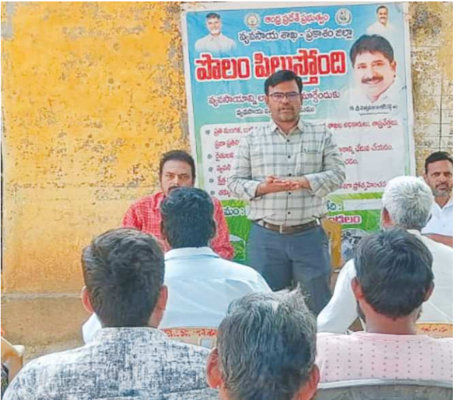
గిద్దలూరు పేన్ పవర్ జనవరి 7

గిద్దలూరు మండలంలో దంతెరపల్లి, ఓబలాపురం తాండ గ్రామంలో