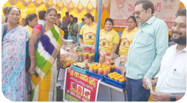
త్రైవే రిపోర్టర్ ఒంగోలు, పేన్ పవర్ జనవరి 07

- నగరంలోని అద్దంకి బస్టాండ్ లో మెప్పా బజార్ ఏర్పాటు