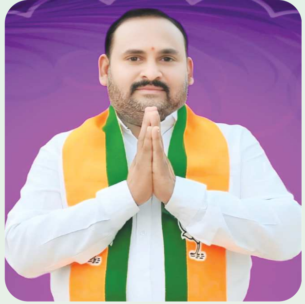
గిద్దలూరు పేన్ పవర్ జనవరి 7

దాడులు పరిష్కారం కాదు !! బిజెపి నేత ఉదయ శంకర్