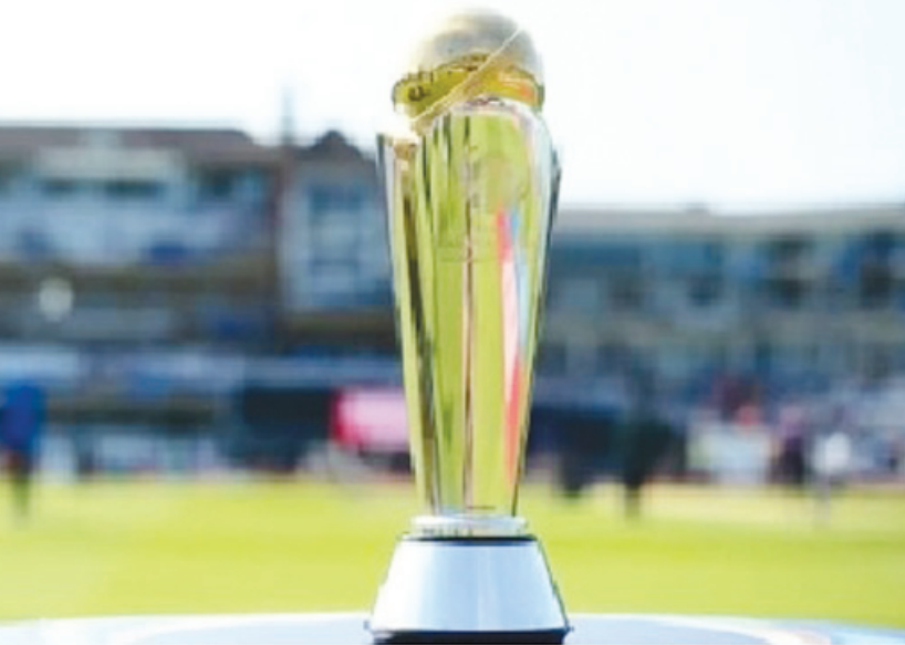
భారత్ గెలిచిన ఏకైక టెస్ట్ మ్యాచ్ కు అతడే సారథిగా వ్యవహరించిన విషయం తెలిసిందే. కాగా, ఆస్ట్రేలియాతో జరిగిన చివరి టెస్టులో గాయపడ్డ జస్టీన్ బుర్రూ ఛాంపియన్స్ ట్రోఫీకి అందుబాటులోకి రావడం దాదాపు ఖాయమే. ఆ సమయానికి కోలుకోనున్నాడు. అయితే ఛాంపియన్స్ ట్రోఫీకి ముందు ఫిబ్రవరి 6 నుంచి ఇంగ్లాండ్ లో జరగనున్న మూడు మ్యాచ్ ల వన్డే సిరీస్ కు అందుబాటులోకి రావడంపై ఇంకా స్పష్టత రాలేదు.

హైదరాబాద్ పెన్ పవర్: ఐసీసీ ఛాంపియన్స్ ట్రోఫీ-2025 ఆరంభానికి సమయం దగ్గరపడుతోంది. పాకిస్థాన్, దుబాయ్ వేదికగా వచ్చే నెలలో ఈ మెగా టోర్నీ జరగనుంది. భారత జట్టుని బీసీసీఐ సెలక్షన్ కమిటీ మరీకొన్ని రోజుల్లోనే ప్రకటించనుంది. జట్టు సారథిగా రోహిత్ శర్మ ఖరారైనట్టు కథనాలు వెలువడుతున్నాయి. అయితే, వైస్ కెప్టెన్ గా ఎవరిని ఎంపిక చేస్తారనే ఉత్కంఠ క్రికెట్ వర్గాల్లో నెలకొంది. భారత స్టార్ పేసర్ జస్టీన్ బుర్రూ వెస్ట్యూన్ ప్రి గాయం నుంచి కోలుకుంటే వైస్ కెప్టెన్ గా సెలక్షన్ ఎంపిక చేస్తారని 'టైమ్స్ ఆఫ్ ఇండియా' పేర్కొంది. పరిమితి ఓవర్ల క్రికెట్ లో వైస్ కెప్టెన్ గా బుర్రూను పరిగణనలోకి తీసుకున్న సందర్భాలు చాలా తక్కువ కావడంతో ఈ తాజా కథనం క్రికెట్ అభిమానులను ఆశ్చర్యానికి గురిచేస్తోంది. మాజీ కోచ్ రాహుల్ ద్రావిడ్ హయాంలో వన్డే, టీ20 జట్టుకు హార్డిక్ పాండ్య వైస్ కెప్టెన్ గా వ్యవహరించేవాడు. కొన్నిసార్లు కేఎల్ రాహుల్ కూడా ఆ బాధ్యతలు నిర్వహించాడు. అయితే, కోచ్ గా గొతమ్ గంభీర్ బాధ్యతలు చేపట్టాక వన్డేలు, టీ20లలో వైస్ కెప్టెన్ బాధ్యతలను శుభేమాన్ గిల్ కు అప్పగిస్తున్నారు. అయితే, ఇటీవల ముగిసిన బోర్డర్-గవాస్కర్ ట్రోఫీలో అదృత వ్యక్తిగత ప్రదర్శనతో పాటు రెండు మ్యాచ్ లకు కెప్టెన్ గానూ వ్యవహరించి రాణించిన బుర్రూకు ఛాంపియన్స్ ట్రోఫీలో వైస్ కెప్టెన్ బాధ్యతలు అప్పగిస్తే మెరుగైన ఫలితాలు ఉంటాయని సెలక్షన్ యొచిస్తున్నట్టు తెలుస్తోంది. ఆస్ట్రేలియాలో