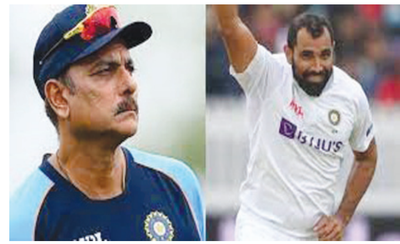
రిహాబిలేషన్ జరిగి చూసేవాడినని వివరించారు. షమీకి ఎంతో అనుభవం ఉందని, ఆస్ట్రేలియా టూర్ కు అతన్ని కూడా ఎంపిక చేసి ఉంటే టీమిండియా బౌలింగ్ విభాగం చాలా బలంగా ఉండేదని అభిప్రాయపడ్డారు.

హైదరాబాద్ పెన్ పవర్: టీమిండియాలో అగ్రశ్రేణి పేసర్ గా ఎదిగిన మహ్మద్ షమీ... 2023 వన్డే వరల్డ్ కప్ తర్వాత గాయం బారినపడి పెద్దగా అంతర్జాతీయ క్రికెట్ ఆడలేదు. షమీకి తగిలిన గాయం ఏంటో, అతడు ఎందుకు ఇన్జూర్డ్ జట్టుకు దూరంగా ఉన్నాడో స్పష్టత లేదు. షమీ దేశవాళీ క్రికెట్ ఆడుతున్నా, ఫిట్ నెస్ లేదంటూ బోర్డర్-గవాస్కర్ ట్రోఫీకి అతన్ని పరిగణనలోకి తీసుకోలేదు. దీనిపై టీమిండియా మాజీ కోచ్ రవిశాస్త్రి స్పందించారు. ఇంతకీ షమీ ఏమైపోయాడు అని ప్రశ్నించారు. షమీకి ఏమైందన్న విషయంపై మీడియాలో జరుగుతున్న ప్రచారాన్ని చూసి తాను ఆశ్చర్యపోయానని వెల్లడించారు. షమీ ఎక్కడున్నాడు? గాయం నుంచి కోలుకున్నాడా? జాతీయ క్రికెట్ అకాడమీకి వెళ్లిన షమీ అక్కడ ఎన్ని రోజులు ఉన్నాడు? ఎందుకు షమీ గురించి సరైన సమాచారం బయటికి రావడంలేదు అని రవిశాస్త్రి ప్రశ్నించారు. ఒకవేళ తనకే అధికారం ఉంటే, ఆస్ట్రేలియా టూర్ కోసం ఎంపిక చేసిన టీమిండియాలో షమీని కూడా చేర్చేవాడినని అన్నారు. అతడు కోలుకోకపోతే జట్టుతో పాటే ఉంటూ