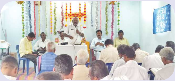
పెద్ద దోర్నాల పెన్ పవర్ జనవరి 6

చర్చి ఆఫ్ క్రైస్ట్ డైరెక్టర్ డిపి యేసయ్య