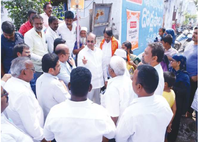
చిలకలూరిపేట పెన్ పవర్ ప్రతినిధి జనవరి 06:

సంక్రాంతి నాటికి రాష్ట్ర వ్యాప్తంగా ఎక్కడా రోడ్లపై గుంతలు.. పెద్ద పెద్ద గోతులు ఉండటానికి వీల్లేదు అన్న ముఖ్యమంత్రి చంద్రబాబునాయుడి ఆదేశాల్లో భాగంగా, పట్టణంలోని వివిధ ప్రాంతాల్లో రూ. 10 లక్షల వ్యయంతో జరుగుతున్న రోడ్ల నిర్మాణ, మరమ్మత్తు పనులను సోమవారం మాజీ మంత్రి పుల్లారావు స్వయంగా పరిశీలించారు. కాంట్రాక్టర్లు, మున్సిపల్ అధికారులతో మాట్లాడి పనుల పురోగతి గురించి తెలుసుకున్న ఆయన ఎన్ని పరిస్థితుల్లో సంక్రాంతి నాటికి పనులన్నీ పూర్తి కావాలని సూచించారు. అవసరమైతే ఎక్కువమంది పనివారిని పెట్టి, నిర్ణీత