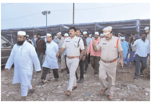
స్టాఫ్ రిపోర్టర్ ఒంగోలు, పెన్ పవర్ జనవరి 06

నిజాముద్దీన్ తల్లీగ ఇస్తిమా ఈ నెల 9,10,11 తేదీల్లో జరుగుతున్న సందర్భంగా సోమవారం జిల్లా ఎస్పీ ప్రభుత్వ బటిబి కాలేజీ ప్రదేశంలోని అక్కడి భద్రత, బందోబస్తు ఏర్పాట్లను పర్యవేక్షించి పోలీస్ అధికారులకు పలు సూచనలు తెలియజేశారు. ఇస్తిమా ఏర్పాట్లపై నిర్వాహకులను వివరాలను అడిగి తెలుసుకున్నారు. ఇస్తిమా జరిగే చుట్టూ పరిసరాలు, ప్రవేశ మార్గములు, పార్కింగ్ స్థలాలను పరిశీలించి, భద్రతా, బందోబస్తు