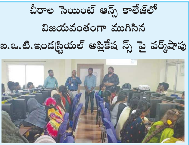
చీరాల సెయింట్ ఆన్స్ కాలేజీలో