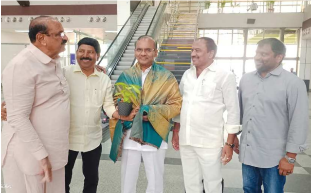
చిలకలూరిపేట పెన్ పవర్ ప్రతినిధి జనవరి 07:

రేపటి సభలో ప్రధాని మోదీ రాష్ట్ర దశ-దిశ చూస్తేలా, ముఖ్యమంత్రి చంద్రబాబు అనుభవం, సమర్థతకు తోడ్పాటునిచ్చేలా కేంద్ర సహాయసహకారం అందిస్తారనే నమ్మకంతో రాష్ట్ర ప్రజలున్నారని పుల్లారావు పేర్కొన్నారు. విశాఖలో నేడు జరగనున్న ప్రధాని నరేంద్ర మోదీ బహిరంగ సభ, రోడ్ షో నిర్వహణ ఏర్పాట్లను మంగళవారం మాజీ మంత్రి ప్రత్తిపాటి పుల్లారావు కూటమి నాయకులతో కలిసి పరిశీలించారు. ఆంధ్రా యూనివర్సిటీ ఇంజనీరింగ్ కళాశాల మైదానంలో బుధవారం సాయంత్రం ప్రధాని బహిరంగసభ జరగనుంది. సభానిర్వహణ, రోడ్ షో లో భాగంగా మాజీ మంత్రి ప్రత్తిపాటి పుల్లారావుకి ప్రభుత్వం జీ.పీ.ఎం.సీ పరిధిలోని కొన్ని వార్డులతో పాటు, పెండ్లర్తి నియోజకవర్గ భార్యతలు అప్పగించిన నేపథ్యంలో ఆయన సభాస్థలంలో జరుగుతున్న ఏర్పాట్లను స్వయంగా పరిశీలించారు. భారీ స్థాయిలో ప్రజలు