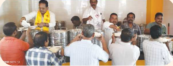
డీపిపి జనసేన పార్టీల నాయకులు