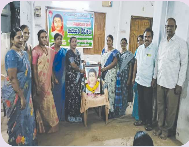
కందుకూరు పెన్ పవర్, జనవరి 5