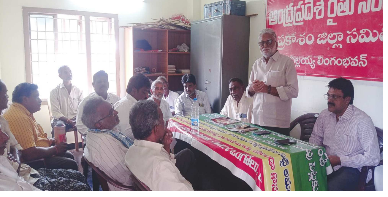
బ్యారో పెన్ పవర్, ప్రకాశం జనవరి 5