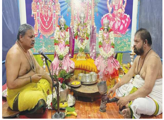
స్టాఫ్ రిపోర్టర్ ఒంగోలు, పెన్ పవర్ జనవరి 29