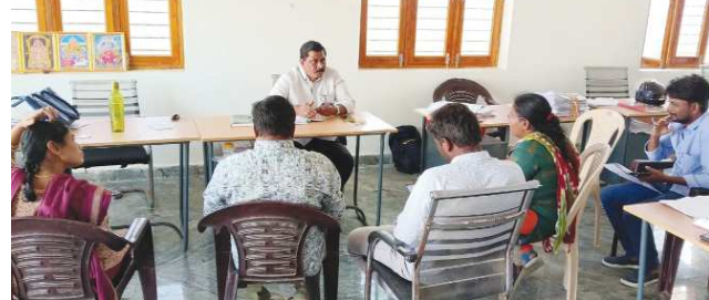
కొమరేలూరు పెన్ పవర్ జనవరి 29

సూరవారిపల్లి గ్రామ సచివాలయాన్ని ఆకస్మికంగా తనిఖీ చేసి రికార్డులు పరిశీలించిన ఎంపీడీవో సయ్యద్ మస్తాన్ వలీ