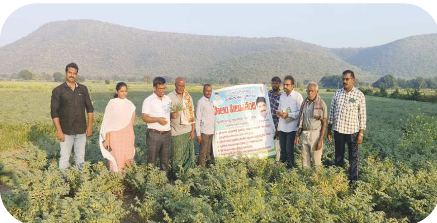
కూలి, వ్యవసాయ ఆధారిత వృత్తులపై జీవించేవారు అర్హులని. నమోదు రైతులు పాల్గొన్నారు.