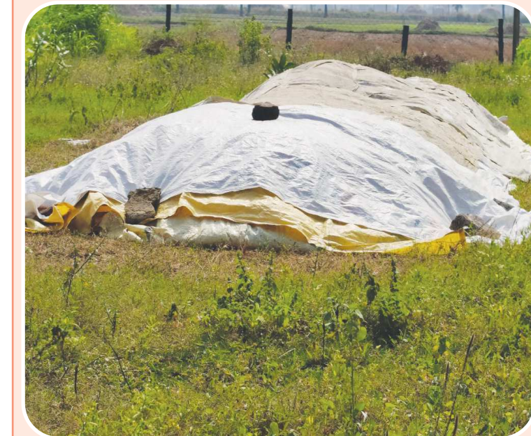
పెన్ పవర్ బ్యూరో బాపట్ల జనవరి 22: ఆరుగాలం పండించిన పంటను కొనే నాధుడు లేక రైతులు అల్లాడిపోతున్నారు. రాష్ట్ర ప్రభుత్వం రైతు దగ్గర నుండి ప్రతి గింజ కొనుగోలు చేస్తామని చెప్పేస్తున్నారే