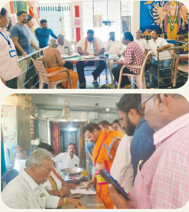
పెన్ పవర్ పామూరు జనవరి 22