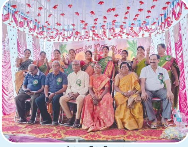
అర్ధవీడు, పెన్ పవర్ జనవరి 22

మండలంలోని పాపినేనిపల్లె లో ఘనంగా గెట్ టుగెదర్ ప్రోగ్రాం నిర్వహించారు. 1994 -95 సంవత్సరానికి చెందిన 10వ తరగతి విద్యార్థులు మండలంలోని పాపినేనిపల్లె జిల్లా పరిషత్ ఉన్నత పాఠశాల విద్యార్థుల ఆత్మీయ సమ్మోళన కార్యక్రమాన్ని ఘనంగా నిర్వహించారు. ఈ పాఠశాల ప్రధానోపాధ్యాయులు మార్కెట్, ఉపాధ్యాయులు మాట్లాడుతూ పాఠశాలను మద్దిపోకుండా పాఠశాలలో ఇలాంటి కార్యక్రమాలు చేయడం చాలా సంతోషమన్నారు. గురువులను ఎప్పుడు మద్దిపోకూడదని ఉన్నత శిఖరాలను ప్రతి ఒక్కరు అధిరోపించాలని కోరారు. ఈ కార్యక్రమంలో