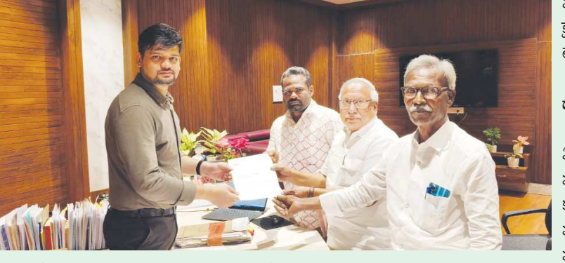
జిల్లాలోని చాలా గ్రామాలు కుటుంబ సమేతంగా ఇతర ప్రాంతాలకు వెళుతున్న పరిస్థితులు స్వయంగా చూశామన్నారు. వలసలకు వెళ్లిన వలస పిల్లలు విద్యకు దూరమవుతున్నారని తెలిపారు. స్వంత గ్రామంలోనే ఉపాధి కల్పించాలని కోరారు. జిల్లాలోని అద్దకి, బాపట్ల, పర్పూరు నియోజకవర్గాల్లో అధికంగా వ్యవసాయ కూలీలు వలసలు వెళుతున్నారన్నారు. వ్యవసాయ కూలీలకు స్వంత గ్రామంలోనే పని కల్పించాలనే ఉద్దేశంతో ఏర్పాటు చేసిన