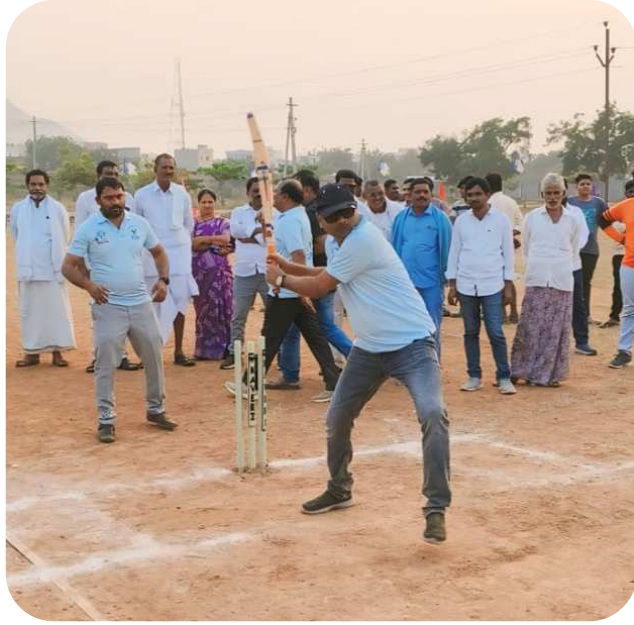
ఆర్ సి ఇన్ ఛార్జి యుగ్రగౌండపాలెం పెన్ పవర్ జనవరి 16