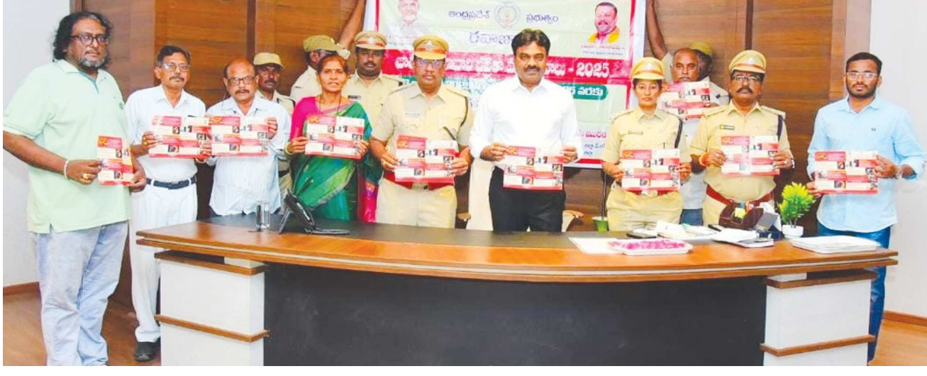
పెన్ పవర్ బ్యారో బాపట్ల జనవరి 16

రోడ్లపై ప్రమాదాలను తగ్గించేందుకు తీసుకోవలసిన జాగ్రత్తలపై వాహన చోదకులకు అవగాహన కల్పించాలని అధికారులకు సూచించిన జిల్లా కలెక్టర్ జె.వెంకట మురళి