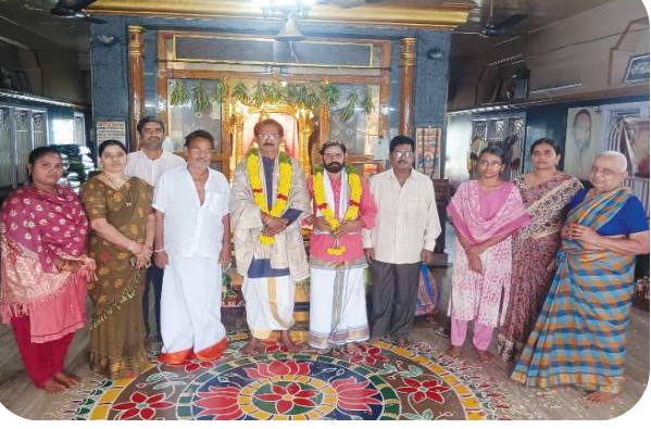
స్టాఫ్ రిపోర్టర్ ఒంగోలు, పెన్ పవర్ జనవరి 16