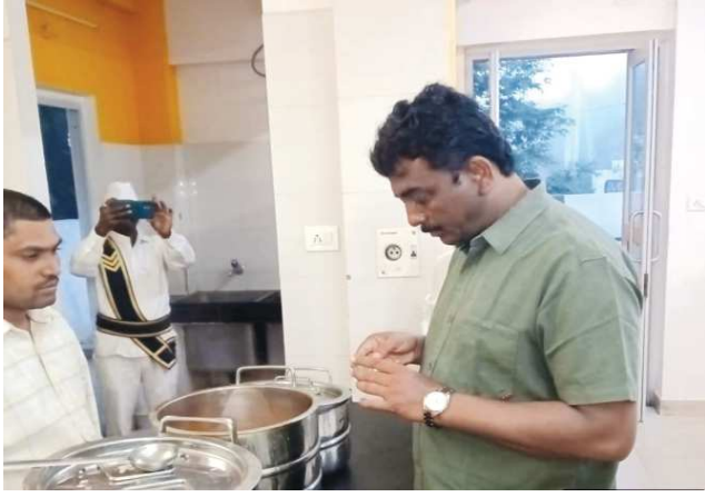
క్రీమ్ రిపోర్టర్ ఒంగోలు, పెన్ పవర్ జనవరి 16

- పాలశుద్ధి పనులు.. అన్న క్యాంటీన్ లను పరిశీలించిన కమిషనర్