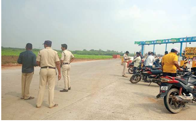
పలేటివారిపాలెం పెన్ పవర్ జనవరి 16