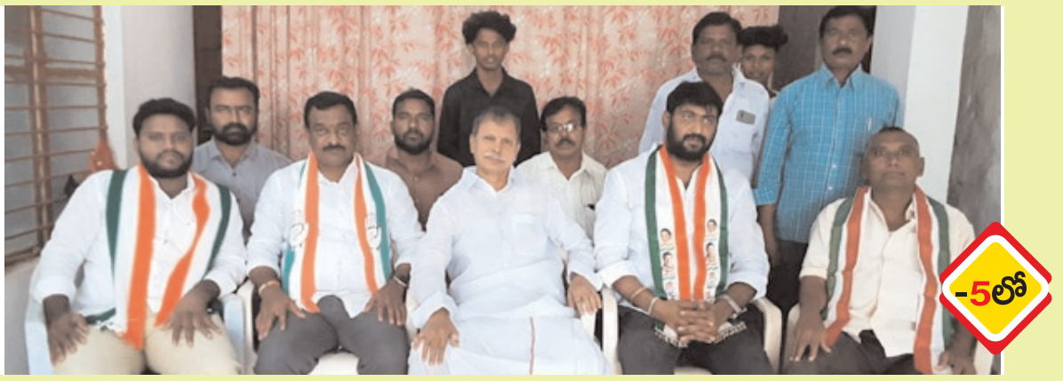
కడప జిల్లాపై కక్ష సాధించడం తగదు!