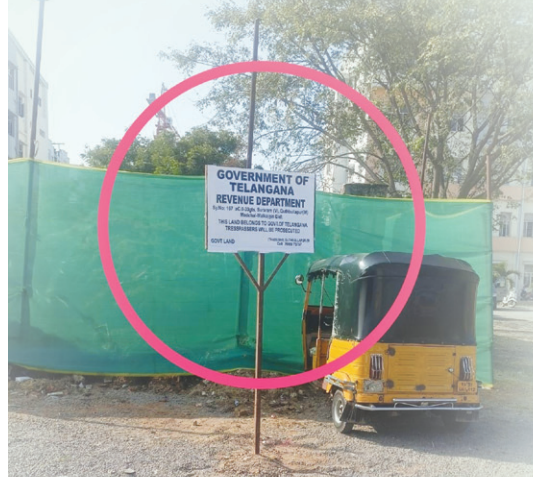
సూరారం సర్వే నెంబర్ 167 లోని 00-33 గుంటల ప్రభుత్వ భూమిలో హెచ్చరిక బోర్డు..