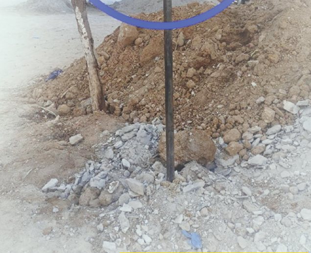
సూరారం సర్వే నెంబర్ 166 లోని 00-07 గుంటల కబ్జాలో హెచ్చరిక బోర్డు..

అధికారుల చర్యలకు అర్థాలే వేరు.. కట్టి విరగదు పాము చావదు.. ఈ సామెత వీరికి వర్తిస్తుంది లేదో కానీ..! రెవెన్యూ అధికారుల విధుల తీరు..! పలువురికి ఆర్హం తెప్పిస్తుంది..! ముడుపులు ముట్టే వరకే చర్యలు.. ఆతర్వాత కంట్రీనల్ పెట్టి నెలలు గడిచినా పట్టించుకోరు.. అందుకు ఉదాహరణ గాజులరామారం సర్వే నెంబర్ "328 పట్ట భూమి" పేరుతో "సర్వే నెం.329 ప్రభుత్వ భూమి"లో కబ్జాదారుల తిప్ప.. అదేచోట గతంలో ఆర్ఎ రజనీకాంత్ పలుమార్లు కూల్చివేతలు జరిపిన సాక్ష్యాలు ఉన్నాయి.. విధుల పట్ల అవగాహన లేకపోతే ఇంటికి వెళ్ళాలి కానీ ప్రభుత్వ భూముల కబ్జాదారులకు అమ్మడు పోతూ చర్యలకు కాలయాపన చేయడం..! చర్యలకు దూరంగా ఉండటం విధులకే కళంకం..! ఇప్పుడు సూరారం సర్వే నెం.166,167 ప్రభుత్వ భూమిలోనూ 2018 లోనే ప్రభుత్వ బోర్డు ఏర్పాటు చేసినప్పటికీ.. మల్లారెడ్డి కబ్జా చేస్తుంటే కుత్బుల్లాపూర్ రెవెన్యూ అధికారులు ఏం చేశారు..? విహారయాత్రకు వెళ్ళారా..? పత్రికల్లో వార్తలు వస్తేనో..! పలువురు ఫిర్యాదులు చేస్తేనో..! రెవెన్యూ అధికారులు స్పందిస్తారా..? అధికారులకు కబ్జాలపై బాధ్యత లేదా..? 1950 నాటి జాగీరుదారుల జమీన్ లో బంగ్లా ఉన్నట్లు ఆధారాలను కూడా చెరిపేసి..! తమ తాతల ఆస్తుల లెక్క ఆక్రమిస్తుంటే..! రెవెన్యూ అధికారులు చోద్యంచూస్తున్నారు.. ఇందుకేనా అధికార యంత్రాంగం విధుల్లో ఉన్నది.. నేతల మెప్పుపొందుతూ.. ప్రజల ఆస్తులను పరాధీనం చేస్తున్న రెవెన్యూ అధికారులు..