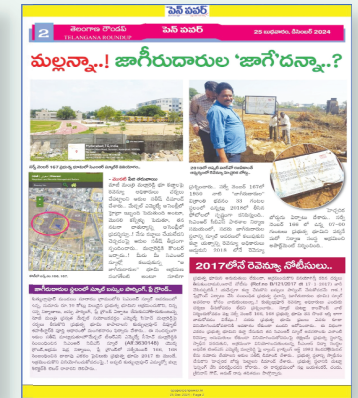
ప్రభుత్వ భూమి కబ్జాపై పెన్ పవర్ దినపత్రికలో వార్తా కథనం..