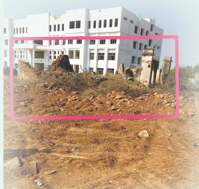
జాగీరుదారుల బంగ్లాను చదును చేసి.. సూల్ బస్సుల పార్కింగ్గా..చేసింది ఇదే.. షైల్ ఫోటో..