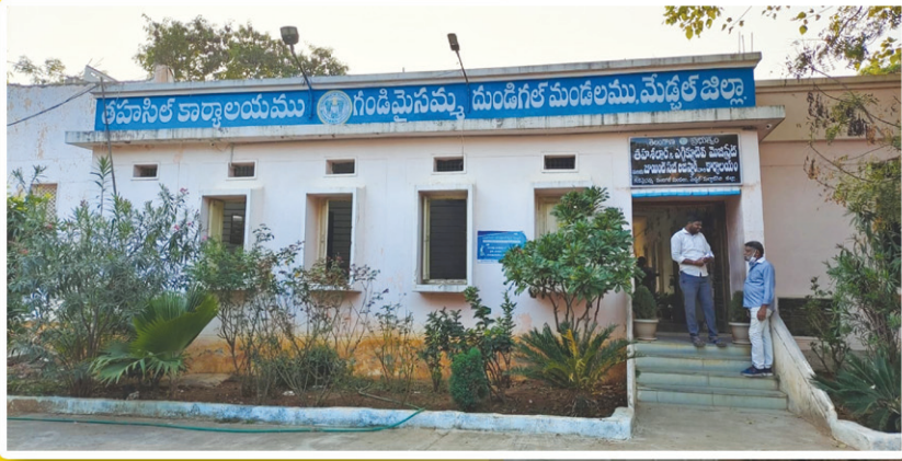
గాగిల్లూర్ సర్వే నెంబర్ 214 ప్రభుత్వ స్థలంలో అక్రమ నిర్మాణం..