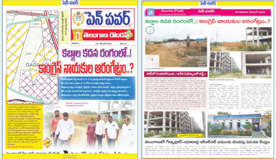
గాగిల్లూర్ ప్రభుత్వ స్థలం కబ్జాపై పెన్ పవర్ దినపత్రికలో వచ్చిన వార్తా కథనం..