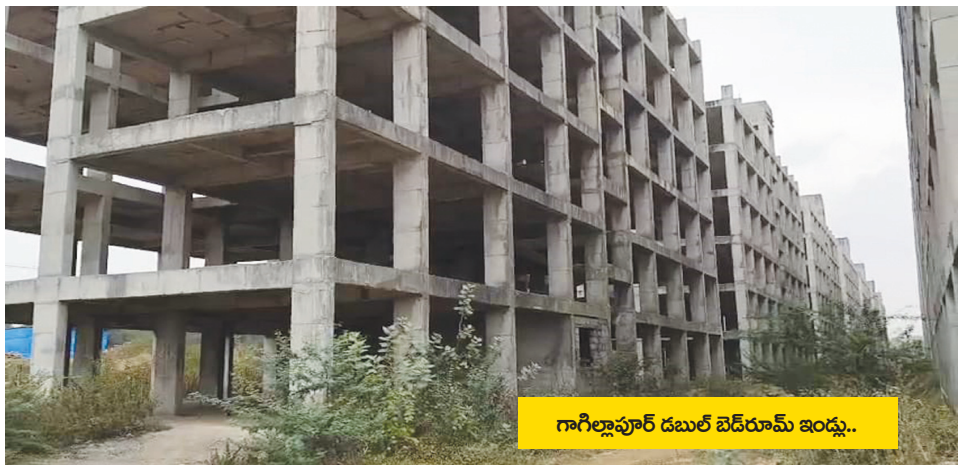
గాగిల్లాపూర్ డబుల్ బెడ్ రూమ్ ఇండ్లు..

చందంగా సంబంధిత అధికారుల వాటా పట్టలు కూడా మేయపు అని ఒక సమేత ఉండేది.. గండిమైసమ్మ సర్వే నెంబర్ 120 ప్రభుత్వ భూమిలో కబ్బాలు..! బహుదూర్పల్లి సర్వే నెంబర్ 227 ప్రభుత్వ భూమిలో రెవెన్యూ సహకార ధోరణి..! బహుదూర్పల్లి 131 ప్రభుత్వ భూమిని ప్రజాప్రతినిధి ఆక్రమించి ఎలాంటి ఎన్ఓసీ, నిర్మాణ అనుమతులు లేకుండా దర్జాగా నిర్మాణాలు.. మల్లంపేట్ 170 ప్రభుత్వ భూమిలో బహిరంగంగానే రియల్ ఎస్టేట్ వ్యాపారం.. గాగిల్లాపూర్ సర్వే నెంబర్ 213, 214 ప్రభుత్వ భూమిలో హెచ్చరిక బోర్డులు తొలగించి అక్రమ నిర్మాణాలు.. ఇవన్నీ స్థానిక అధికారులకు తెలియకుండా జరిగే అవకాశం ఉండా కలెక్టర్ సార్..