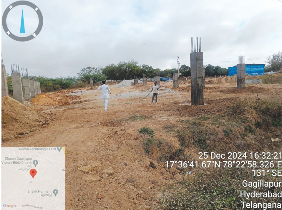
ప్రభుత్వ స్థలంలో లక్షమ నిర్మాణ పనులు..