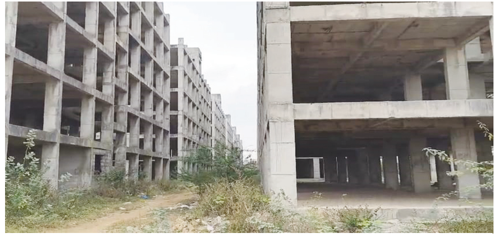
గాగిల్లాపూర్ డబుల్ బెడ్ రూమ్ ఇండ్ల సముదాయం..