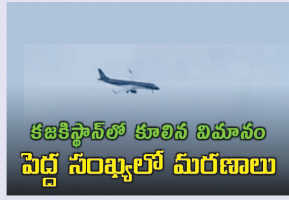
కజకిస్థాన్లో కూలిన విమానం పెద్ద సంఖ్యలో మృతగాలు

హైదరాబాద్ పెన్ పవర్: కజకిస్థాన్లో ఘోర విమాన ప్రమాదం జరిగింది. 105 మంది ప్రయాణికులు, ఐదుగురు సిబ్బందితో వెళుతున్న 'అజర్ బైజాన్ ఎయిర్ లైన్స్'కు చెందిన జే2-8243 విమానం అక్కడ విమానాశ్రయానికి సమీపంలో కుప్పకూలింది. ఈ ఘటనలో పెద్ద సంఖ్యలో మరణాలు సంభవించినట్లు తెలుస్తోంది. ప్రాథమిక సమాచారం ప్రకారం కేవలం ఆరుగురు మాత్రమే ప్రాణాలతో బయటపడ్డారని కజకిస్థాన్ వైద్య మంత్రిత్వ శాఖ వెల్లడించింది. ప్రమాదానికి గురైన విమానం అజర్ బైజాన్ రాజధాని బాకు నుంచి రష్యాలోని చెప్యాలోని గ్రోజ్నీకి వెళ్లాల్సి ఉంది. అయితే, దట్టమైన పొగమంచు కారణంగా విమానాన్ని దారి మళ్లించినట్లుగా అంతర్జాతీయ మీడియాలో కథనాలు వెలువడుతున్నాయి. ఈ ఘటనకు సంబంధించిన పూర్తి వివరాలు అందాల్సి ఉంది. కాగా, కుప్పకూలిన దృశ్యాలు సోషల్ మీడియాలో చక్కర్లు కొడుతున్నాయి.