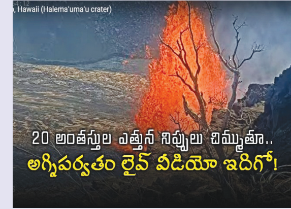
20 అంతస్తుల ఎత్తున నిప్పులు చిమ్ముతూ.. అగ్నిపర్వతం లైవ్ వీడియో ఇదిగో!

హైదరాబాద్ పెన్ పవర్: అమెరికాలోని హవాయ్ దీవుల్లో ఉన్న కిలోవా అగ్నిపర్వతం... ఒక్కసారిగా బద్దలైంది. భారీ శబ్దంతో లావా బాంబులు, విషవాయువులను ఎగజిమ్మింది. ఆ తర్వాత నుంచి భారీ స్థాయిలో లావా వెలువడుతోంది. స్థానిక కాలమానం ప్రకారం సోమవారం తెల్లవారుజామున 3 గంటల సమయం (మన కాలమానం ప్రకారం సోమవారం మధ్యాహ్నం రెండు గంటల సమయం)లో ఈ అగ్నిపర్వతం బద్దలవడం మొదలైందని అమెరికా జియాలజికల్ సర్వే (యూఎస్ జీఎస్) విభాగం ప్రకటించింది.