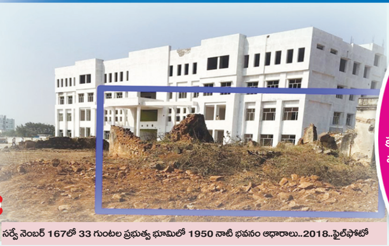
సర్వే నెంబర్ 167లో 33 గుంటల ప్రభుత్వ భూమిలో 1950 నాటి భవనం ఆధారాలు..2018..ఫైల్ ఫోటో

2018లో సిఎంఆర్ స్కూల్ నిర్మాణ సమయంలో తీసిన ఫోటో.. జాగీరుదారుల భవనం శిథిలమైనది చూడవచ్చు..