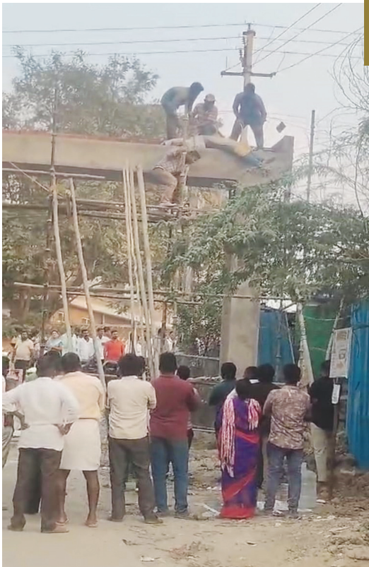
విద్యుత్ వైర్లకింద నిర్మాణంలో ఉన్న కమాన్ పై పడి ఉన్న మృతదేహాన్ని దించుతున్న దృశ్యం..

సుమోటోగా కేసునమోదు చేసుకొని దర్యాప్తు చేస్తున్న దుండిగల్ పోలీసులు..