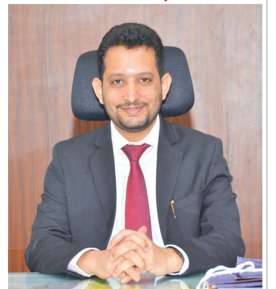
గౌతమ్ పోట్లు.. మేడ్చల్ మల్కాజిగిరి జిల్లా కలెక్టర్..

జీసస్ కరుణామయుడుగా, దయామయుడుగా అందరి ఆరాధనలు అందుకుంటున్నారని అన్నారు. సాటి మనుషుల పట్ల ప్రేమ, నిస్సహాయుల పట్ల కరుణ, శత్రువుల పట్ల క్షమ, ఆకాశమంతటి సహనం, అవధులు లేని త్యాగం, శాంతియుత సహజీవనం, శత్రువుల పట్ల నైతం క్షమా గుణం కలిగి ఉండటమే యేసుక్రీస్తు అందరికీ ప్రబోధించారని దీనిని అనుసరించాలని కలెక్టర్ ఆకాంక్షించారు. కలెక్టర్ మల్కాజిగిరి జిల్లా ప్రజలందరికీ క్రిస్మస్ శుభాకాంక్షలు తెలిపారు..