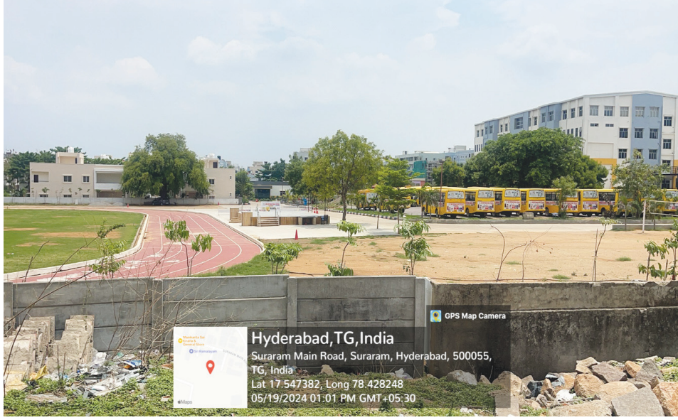
సర్వే నెంబర్ 167 ప్రభుత్వ భూమిలో సిఎఆర్ స్కూల్ కి వినియోగం..