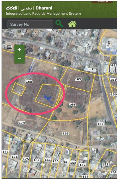
ధరణిలో సర్వే నెం.166, 167.