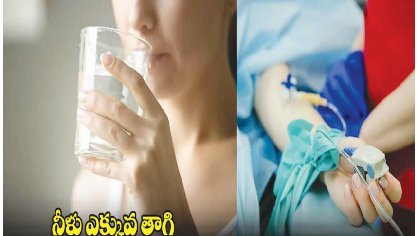
నీళ్లు ఎక్కువ తాగి

హైపోనాట్రేమియా నిర్ధారణ అధికంగా నీరు తాగడం వల్ల మహిళకు