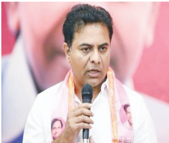
రేస్ కు సంబంధించి సీజన్-9కి అగ్రిమెంట్ కుదిరిందని... సీజన్-10కి అగ్రిమెంట్