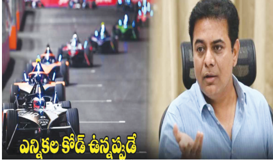
ఎన్నికల కోడ్ ఉన్నప్పుడే

హైదరాబాద్ పెన్ పవర్: ఫార్ములా ఈ రేస్ కేసులో సంచలన విషయాలు వెలుగులోకి వస్తున్నాయి.. ఈ వ్యవహారంలో భారీగా డబ్బులు లండన్ కు తరలించినట్లు తెలుస్తోంది. ఈ రేసు అగ్రిమెంట్ లో భాగంగా 2023 ఫిబ్రవరిలో 9 సీజన్ ముగియడంతో ఈ ఏడాది ఫిబ్రవరి 10న సీజన్ 10 నిర్వహించాల్సి ఉంది. ఈ క్రమంలో వివిధ కారణాలతో సీజన్ 10 రద్దు చేసుకుంటున్నట్లు ఫార్ములా ఈ ఆపరేషన్స్ సంస్థ 2023 అక్టోబర్ 27న నాటి రాష్ట్ర ప్రభుత్వానికి సమాచారం ఇచ్చింది. దీంతో ఫార్ములా ఈ ఆపరేషన్స్, ఎంపియూడి మధ్య 2023 అక్టోబర్ 30న కొత్త అగ్రిమెంట్ జరిగింది. ఈ వెంట నిర్వహణ కోసం రూ.90 కోట్లు ఎంపియూడి ఇచ్చేందుకు అంగీకారం కుదిరింది. ఈ క్రమంలోనే అక్టోబర్ 10న అసెంబ్లీ ఎన్నికల కోడ్ అమల్లోకి వచ్చి, డిసెంబర్ 4 వరకు కొనసాగింది. అక్టోబర్ 3న ఫస్ట్ ఇన్ స్టాల్ మెంట్ కింద రూ.22 కోట్ల 69 లక్షల 63 వేల 125 , అక్టోబర్ 11న రెండో ఇన్ స్టాల్ మెంట్ కింద రూ.