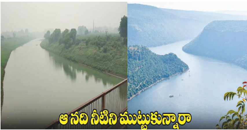
ఆ నది నీటిని ముట్టుకున్నారా

ఏ ప్రాణి జీవించాలన్నా నదులే ఆధారం. అందుకనే అవి పూజించే విధంగా.. కృష్ణ, గోదావరి, గంగా ఇలా ఏ నదైనా పుణ్యక్షేత్రాల పక్కనే ఉంటాయి. నదుల్లో పుణ్యస్నానం ఆచరించి స్నాని వారి స్నానం ఆచరిస్తారు. నది స్నానానికి ఎంతో విశిష్టత ఉందని పురాణాలు చెబుతాయి. కాని మన దేశంలో ఓ నదిని తలవరు.. అందులోని నీటిని తాగరు.. కనీసం కాళ్ళు కూడా కడగరు... అంటుకోరు. పురాణాలు తెలిపిన ప్రకారం ఈ నది శాపగ్రస్త నది అంటారు. దీనినే కర్మనాశ నది అని కూడా అంటారు. పురాణాల ప్రకారం హరిశ్చంద్ర రాజు తండ్రి సత్యవ్రతుడు.. ఇతడు చాలా ధైర్యవంతుడు. సత్యవ్రతుని గురువు వశిష్ఠుడు.. వేద విద్యలు అభ్యసించిన తరువాత.. సత్యవ్రతుడు అతని గురవైన వశిష్ఠుడిని ఓ వరం కోరాడు. ప్రాణం ఉండగానే స్వర్గలోకానికి వెళ్లాలని ఉందని ఆ కోరికను ఎలాగైనా తీర్చమని ప్రాధేయపడతాడు. అయితే ఆ కోరికను తీర్చడానికి వశిష్ఠుడు నిరాకరించాడు. అప్పుడు వశిష్ఠుడి పై కోపంతో సత్యవ్రతుడు విశ్వామిత్రుడి వద్దకు వస్తాడు. విశ్వామిత్రుడికి.. వశిష్ఠుడు అంటే అసూయ, అకారణ శత్రుత్వం కారణంగా.. వశిష్ఠుడు కాదన్న రాజు