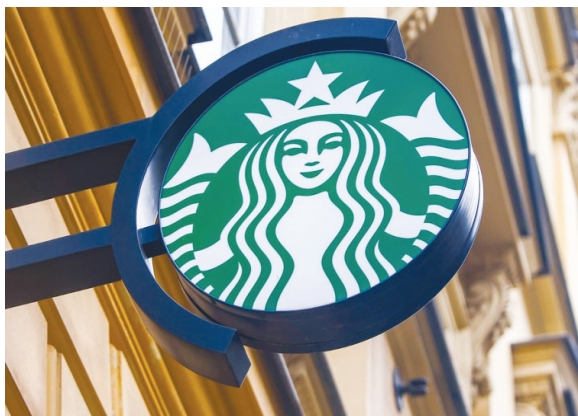
హైదరాబాద్ పెన్ పవర్:ప్రముఖ కాఫీ చైన్ 'స్టార్బక్స్' భారత మార్కెట్ నుంచి స్టాక్ ఎక్స్చేంజ్ కు గురువారం నాడు లేఖ

నిష్క్రమించబోతోందంటూ రోజులుగా వెలువడుతున్న మీడియా కథనాలపై టాటా గ్రూపు సంస్థ 'టాటా కన్స్యూమర్ ప్రొడక్ట్స్' క్లారిటీ ఇచ్చింది. స్టార్బక్స్ పై జరుగుతున్న ప్రచారం నిరాధారమని కొట్టిపారేసింది. ఊహగానాలను ఖండించింది. ఈ మేరకు నేషనల్ స్టాక్ ఎక్స్చేంజ్ ఆఫ్ ఇండియా, బీఎస్ఈ లిమిటెడ్, కలకత్తా స్టాక్ ఎక్స్చేంజ్ కు గురువారం నాడు లేఖ