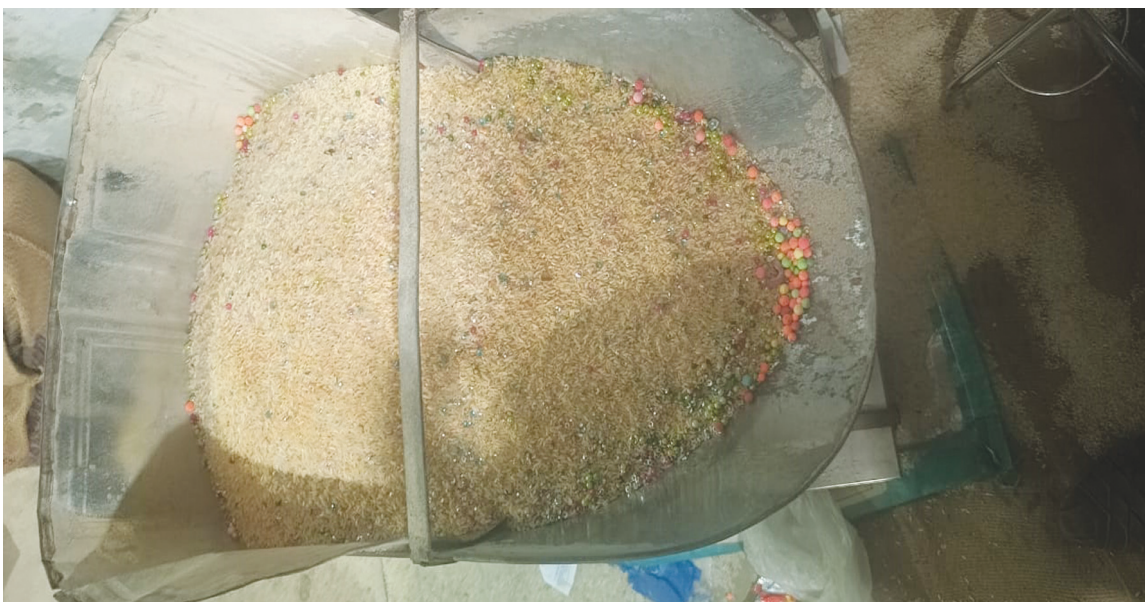
కుత్బుల్లాపూర్ సూరారం రాజీవ్ గృహకల్పలో రేషన్ షాపులో కల్లి బియ్యం..

స్పష్టమవుతుంది.. అయితే తాజాగా సూరారం కాలనీ రాజీవ్ గృహ కల్పలో రేషన్ షాపు నెంబర్ 203 లో వినియోగదారులకు సరఫరా చేసిన బియ్యంహౌ పెళ్ళికి వినియోగించే తలంబ్రాల బియ్యం లాగా ఉండటమే కాకుండా రంగురంగుల ధర్మకోల్ బాల్స్ తో సహా రావడం ఆశ్చర్యాన్ని కలిగిస్తుంది. ప్రజా పంపిణీ వ్యవస్థ ఎంత దుర్భర స్థితిలో ఉందో తెలుస్తోంది.. అధికారుల నిర్లక్ష్యానికి ఇది అద్దం పడుతుంది..