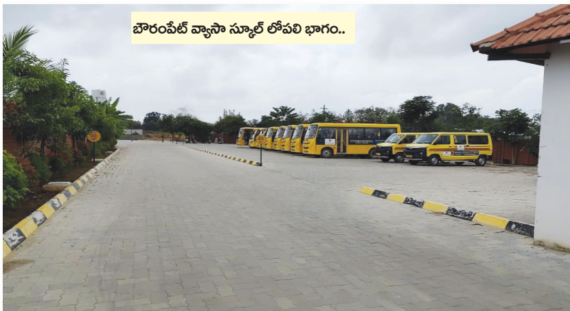
బౌరంపేట్ వ్యాసా స్కూల్ లోపలి భాగం..