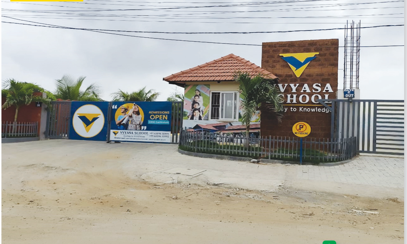
బౌరంపేట్లోని వ్యాసా స్కూల్..

మేడ్చల్ జిల్లా బ్యూరో, పెన్ పవర్, డిసెంబర్ 17: