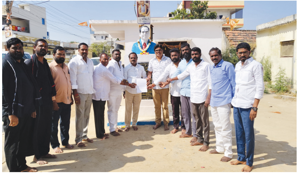
దుండిగల్ మున్సిపల్ దొమ్మర పోచంపల్లిలో అంబేద్కర్ కి బీఆర్ఎస్ నేతల వినతిపత్రం..