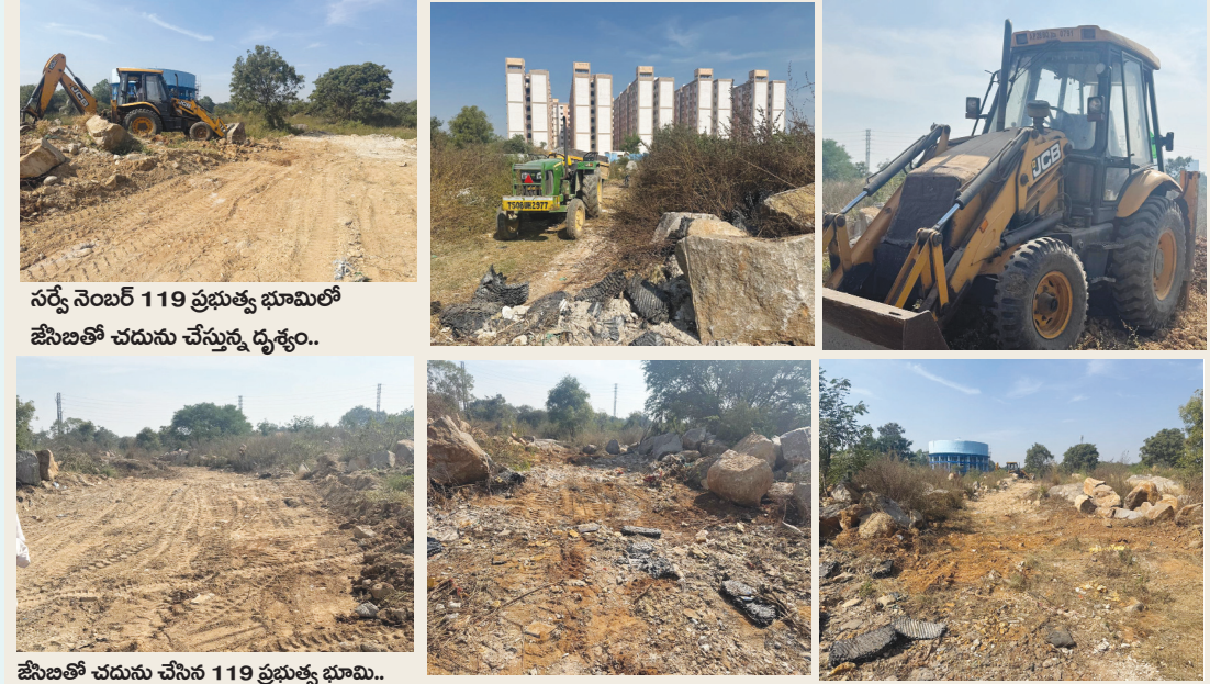
సర్వే నెంబర్ 119 ప్రభుత్వ భూమిలో జేసిబి తో చదును చేస్తున్న దృశ్యం..