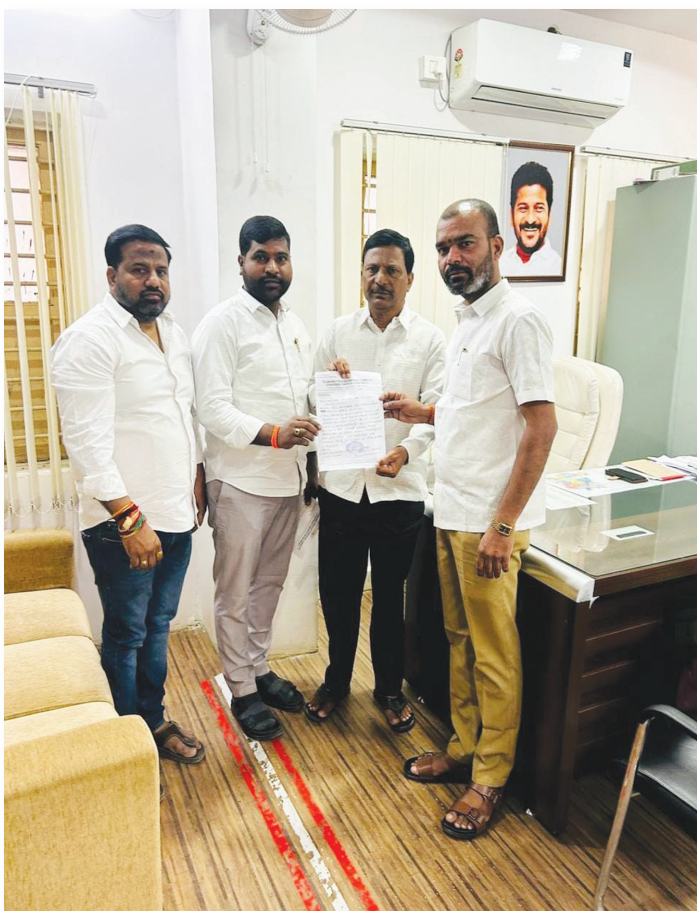
బౌరంపేట్ వ్యాసా స్కూల్పై ఫిర్యాదు చేస్తున్న స్థానికులు..

మిగిలిన అనుమతులపై ప్రశ్నిస్తే..! మున్సిపల్ కమిషనర్ సత్యనారాయణ సైలెంట్..!