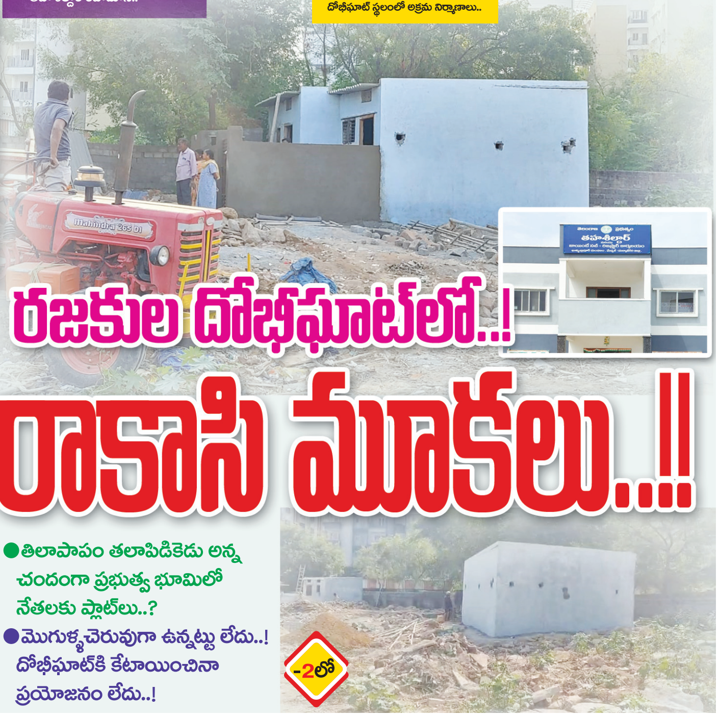
దోభిఘాట్ స్థలంలో అక్రమ నిర్మాణాలు..