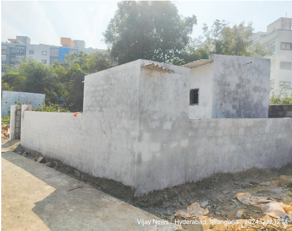
Vijay News | Hyderabad, Telangana | 2024-12-12 12:14