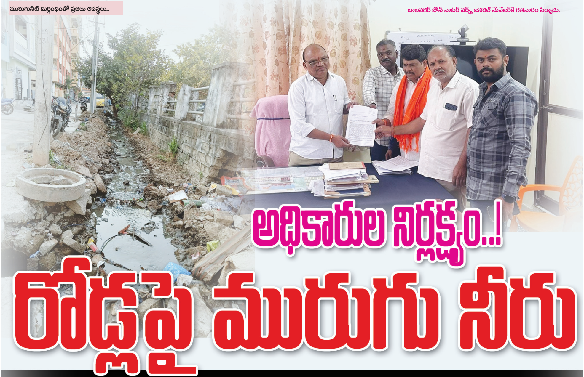
బాలనగర్ జోన్ వాటర్ వర్డ్ జనరల్ మేనేజర్ కి గతవారం ఫిర్యాదు.