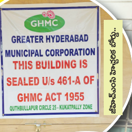
జీహెచ్ఎంసీ సీల్ చేసిన ఫోటో..

తెలంగాణ రాష్ట్ర ఏర్పడిన తర్వాత..గత బిఆర్ఎస్ ప్రభుత్వంలో ప్రతిష్టాత్మకంగా అమలు చేసిన బీజి-బిపాస్ చట్టం..! సంబంధిత అధికారులకు కల్పితంవుగా మారినది చెప్పవచ్చు.. ప్రారంభంలో అత్యంత కఠినమైన నిబంధనలతో (ఎలాంటి నోటీసులు జారీ చేయకుండానే కూర్చివేసే విధంగా) చట్టాన్ని రూపొందించి నప్పటికీ..! తెలివిగా చట్టసవరణ చేయించడంలో టౌన్ ప్లానింగ్ అధికారులే కీలకపాత్ర పోషించినట్లు ఆరోపణలు వచ్చాయి.. మున్సిపల్ చట్టాన్ని అమలు చేసిన గత ప్రభుత్వం..! ఆచరణలో పెట్టేందుకు అధికారులపై ఒత్తిడి తీసుకురాకుండా "పాలకులు" హుకుంజారీ చేయడం..! జిల్లా, గవీ నాయకుల మాటను జవదాటకూడదనే అన్ని ప్రభుత్వ శాఖలకు అనధికారికంగా ఆదేశాలు ఉండేవట..? దీంతో "తిలాపాపం తలాపిడికెడు" అన్న చందంగా "దొంగలు దొంగలు ఊర్లు పంచుకున్న" తీరుకు అద్దం పడుతున్నారని సర్వత్రా విమర్శలు వెల్లువెత్తాయి.. అటు బీజి-బిపాస్ చట్టాన్ని నిర్లక్ష్యం చేశారు..! ఇటు కొందరు కేవలం పార్టీ కందుపాలు కప్పుకుని నేతలుగా చలామణి అవుతూ..! అక్రమ నిర్మాణాలపై నూకొక్క పాల్వడే కుటుంబాలు లేకపోలేదు..! ఈ అక్రమ నిర్మాణం విషయంలో ముందుగా తమ్ముని ఫిర్యాదుతో కూర్చివేతలు, తర్వాత అన్న ఫిర్యాదుతో సీల్ చేసినట్లు ఆరోపణలు ఉన్నాయి.. టౌన్ ప్లానింగ్ అధికారుల విధులు, ప్రజలకు ఏమేరకు ఉపయోగ పడుతున్నాయో ఏమోకానీ..! అక్రమార్కులకు, అధికారులకు, నేతలకు మాత్రం జేబులు నింపుతున్నారని అర్థమవుతుంది.. ఈ మొత్తం వ్యవహారంలో "ముడుపులు" కామన్ గా నిలుస్తున్నాయని స్పష్టమవుతుంది..