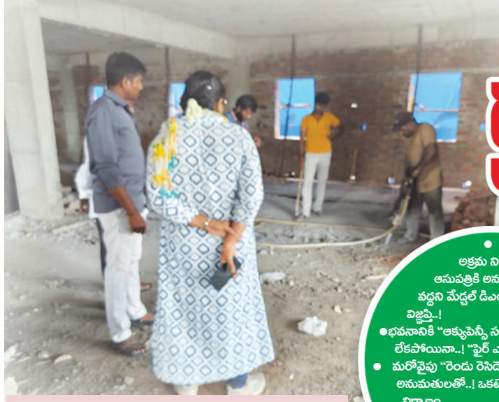
2024 జూలై 6న కూర్చివేతలు చేపడుతున్న..నాటి ఫైల్ ఫోటో..

అక్రమ నిర్మాణంలో ఆసుపత్రికి అనుమతి ఇవ్వ వద్దని మేడ్చల్ డివిజన్ డి.ఓ.కి స్థానికులు విజ్ఞప్తి..! ● భవనానికి "అక్యూసెన్సీ సర్టిఫికేట్" లేకపోయినా..! "ఫైల్ ఎన్ఎఫ్ఎస్ఐ" ప్రయత్నం.. ● మరోవైపు "రెండు రెసిడెన్షియల్ అనుమతులతో..! ఒకటే కమర్షియల్ కాంప్లెక్స్ నిర్మాణం.. ● చింతల్ మెయిన్ రోడ్లోని ఈ అక్రమ నిర్మాణాన్ని 2024 జూలై 6న కూర్చివేతలు..పాక్షికమే..!