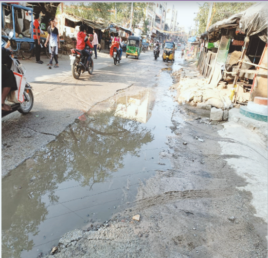
సూరారం కాలనీలో పాంగి పార్శుతున్న డ్రైనేజీ నీరు..