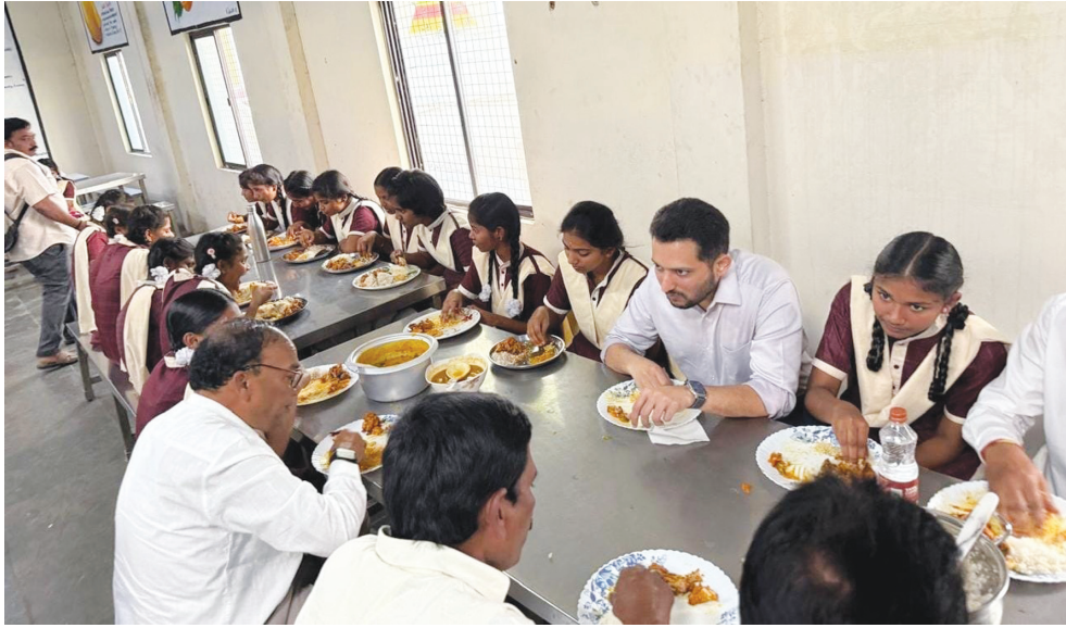
వసతి గృహంలో విద్యార్థులతో కలెక్టర్ సహపంక్తి భోజనం..