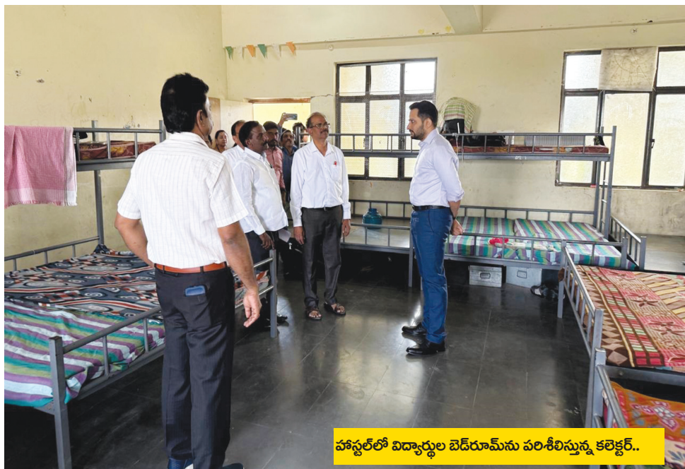
హాస్టల్‌లో విద్యార్థుల బెడ్‌రూమ్‌ను పరిశీలిస్తున్న కలెక్టర్..

ఇకపై విద్యార్థులకు హైజీన్ పౌష్టికాహారం యూనిఫామ్ షూస్, సాక్సులు, కాస్మెటిక్ చార్జీలు కూడా అందించనున్నట్లు కలెక్టర్ తెలిపారు.. ముఖ్యంగా తల్లిదండ్రులు గ్రహించాలన్నారు.. ప్రస్తుత ప్రభుత్వం ప్రత్యేక శ్రద్ధతో, దశాబ్దాలుగా నిలకడగా ఉన్న మెన్ చార్జీలను 40 శాతానికి పెంచడంతో పాటు..! నేటి నుండి విద్యార్థులకు మెనూ చాట్‌లో నిర్ణయించిన ప్రకారమే పౌష్టికాహారాన్ని అందించాలని..! విద్యార్థుల ఆరోగ్యం పట్ల ప్రత్యేక శ్రద్ధ వహించాలని ఫ్యాకల్టీకి కలెక్టర్ సూచించారు..