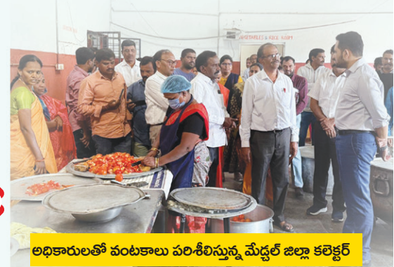
అధికారులతో వంటశాల పరిశీలిస్తున్న మేడ్చల్ జిల్లా కలెక్టర్