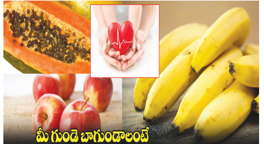
మీ గుండె బాగుండాలంటే

హైదరాబాద్ పెన్ పవర్: ప్రతిరోజూ పరగడుపున అరకప్పు బొప్పాయి ముక్కల్ని తీసుకుంటే బరువు తగ్గడంతో పాటు గుండె ఆరోగ్యంగా ఉంటుందని వైద్యులు చెబుతున్నారు. దీంతో పాటు యాపిల్ కూడా తీసుకుంటే మరింత ఆరోగ్యం చేకూరుతుందని చెబుతున్నారు. రోజులో ఏదో ఒక సమయంలో అరటిపండు తినడం కూడా మంచిది. అరటిలోని కెరోటినిన్ అనే పదార్థం మానసిక రుగ్మతలను దూరం చేస్తుంది. అరటిపండు.. బొప్పాయి.. యాపిల్ తినడం వలన గుండె ఆరోగ్యానికి ఎలాంటి దోకా ఉండదు. అలాగే చేపలు తినడం ద్వారా ఒమేగా 3 ఫ్యాట్స్ లభిస్తాయి. ఇవి గుండెపోటును అరికడతాయి. శరీరానికి కావాల్సిన నీటిని, పీచు పదార్థాలను తీసుకోవడం ద్వారా ఆరోగ్యంగా ఉంటారు.