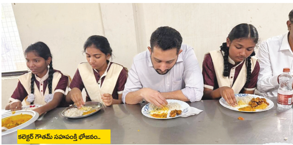
కలెక్టర్ గౌతమ్ సహపంక్తి భోజనం..