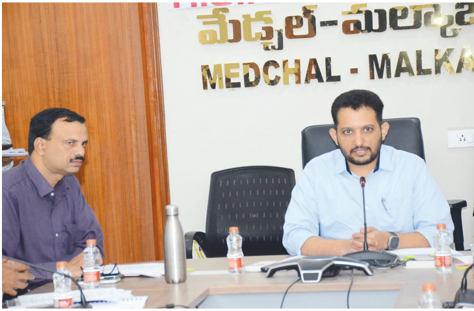
సమావేశంలో జిల్లా కలెక్టర్ గౌతమ్, అడిషనల్ కలెక్టర్ విజయేందర్ రెడ్డి..

వివిధ శాఖల అధికారులతో మేడ్చల్ జిల్లా కలెక్టర్ గౌతమ్ సమీక్ష సమావేశం..