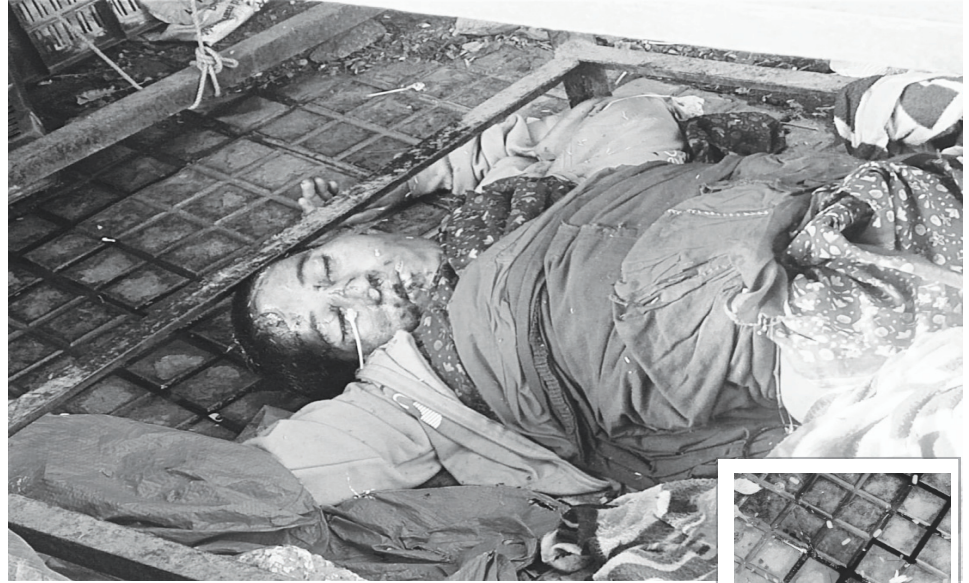
జీడిమెట్ల పియస్ లో హత్యకు గురైన గుర్తు తెలియని మహిళ..

ఇదిలా ఉండగా సంఘటన జరిగిన ప్రదేశం రోడ్డు పక్కన చౌరస్తా సమీపంలో వాహనాలు, పాద చారులతో రద్దీగా ఉండే ప్రదేశం అయినందున ఈ ప్రదేశానికి పక్కనే లాల్ బిల్డు, డ్రైవర్లు క్షీనర్లు ఇసుక వ్యాపారస్తులు జనసంచారంతో ఎప్పుడూ ఉంటారు.. మరోవైపు పక్కనే ఉన్న హెచ్ఎంటి జంగల్ ప్రదేశంలోగతంలో ఎన్నో హత్యలు ఆత్మహత్యలు జరిగిన విషయం తెలిసిందే. రాత్రి పగలు రద్దీగా ఉండే రోడ్డు, పోలీస్ స్టేషన్ కి సమీపంలో ఉన్నప్పటికీ.. నేరం జరగడం స్థానికులు భయాందోళన చెందుతున్నారు.. పోలీస్ పెట్రోలింగ్ నిఘాను మరింత పెంచి ఇలాంటి ఘటనలు పునరావృతం కాకుండా చూడాల్సిన అవసరం ఉందని స్థానికులు కోరుతున్నారు..