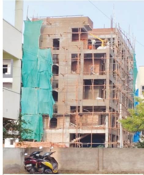
గాజులరామారం శ్రీరామ్ నగర్లో..