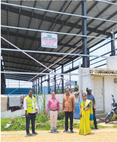
కుత్బుల్లాపూర్ సర్కిల్-25 పరిధి సుభాష్ నగర్లో సీజ్ చేసిన షెడ్యూలర్..