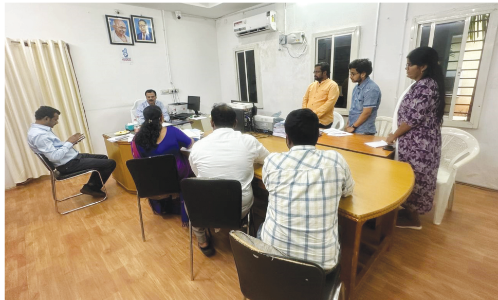
ఘట్టేసర్ తహశీల్దార్ కార్యాలయంలో అదనపు కలెక్టర్..