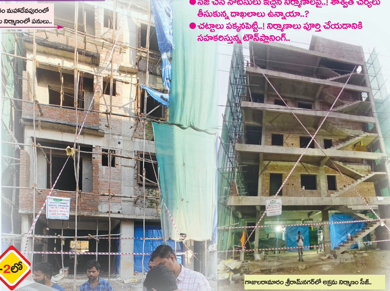
గాజులరామారం శ్రీరామ్ నగర్లో అక్రమ నిర్మాణం సీజీ..