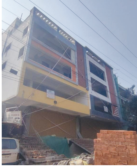
కుత్బుల్లాపూర్ సర్కిల్-25 పరిధిలో నిర్మాణం సీజ్..