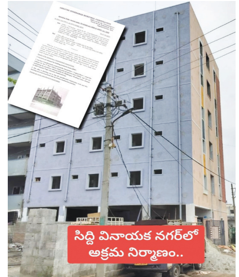
సిద్ది వినాయక నగర్లో అక్రమ నిర్మాణం..