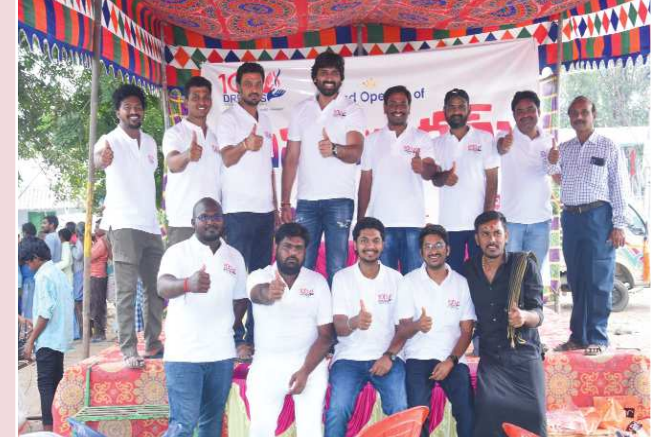
సీతమ్మ ఆదర్శంలో, అన్న సూక్రమ్ ఫుడ్ స్టాల్స్ ని ప్రముఖ నగర్ లో విస్తరించాలని నిర్ణయించామని, అందులో భాగంగా, ఆంధ్ర ప్రదేశ్ రాష్ట్రంలోని వేటపాలెం మండలంలో, అన్న సూక్రమ్ ఫుడ్ స్టాల్ ని ఏర్పాటు చేసి, పేదలకు రూ. 1 తో భోజనం అందజేయాలని నిర్ణయించి, స్టాల్ ను ప్రారంభించడం జరిగిందన్నారు. గౌరవ అతిథులు గా జెడ్డె