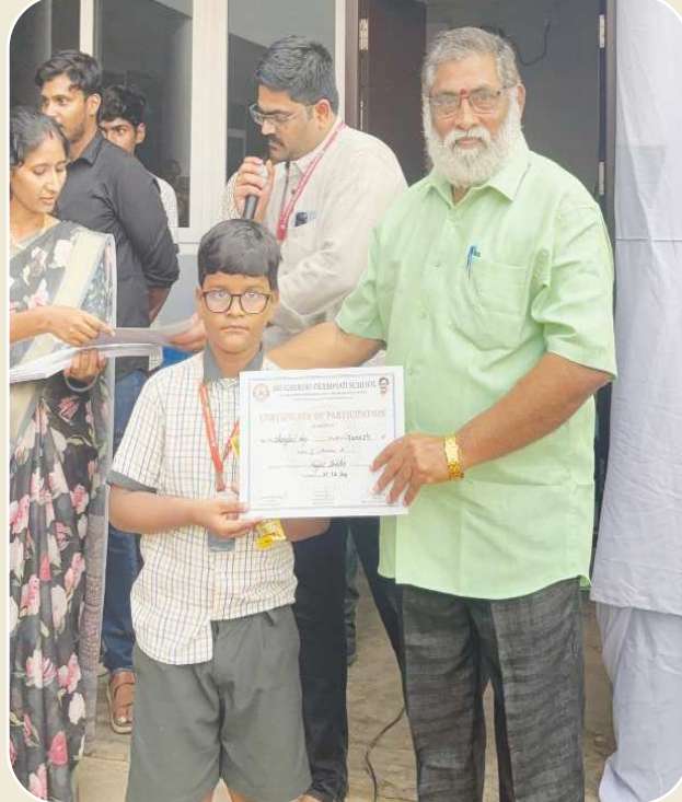
కందుకూరు పెన్ పవర్, డిసెంబర్ 22

పట్టణంలోని శ్రీ గాయత్రి ఒలింపియాడ్ స్కూల్ లో జాతీయ గణిత దినోత్సవాన్ని పురస్కరించుకుని, డిసెంబర్ 22న జరుపుకునే గ్రాండ్ మ్యాథ్ ఎక్స్ పోను సగర్వంగా నిర్వహించారు. పాఠశాల ఒలింపియాడ్ క్యాంపస్ లో జరిగిన ఈ కార్యక్రమం, ఉత్సాహభరితంగా పాల్గొని అద్భుతమైన విజయాన్ని సాధించింది. విద్యార్థులు, విద్యావేత్తల నుండి మ్యాథ్ ఎక్స్ పోలో యువ అభ్యాసకులను ఆకర్షించడానికి గణితంపై ప్రేమను ప్రేరేపించడానికి రూపొందించబడిన ఇంటరాక్టివ్ డిస్ ప్లేలు, ఆకర్షణీయమైన గణిత సవాళ్లు, హ్యాండ్-ఆన్ కార్యక్రమాలు నిర్వహించారు. ఈ సంఘటన రోజువారీ జీవితంలో గణితశాస్త్రం యొక్క అందం, ప్రాముఖ్యతను హైలైట్ చేసింది, విషయం పట్ల లోతైన