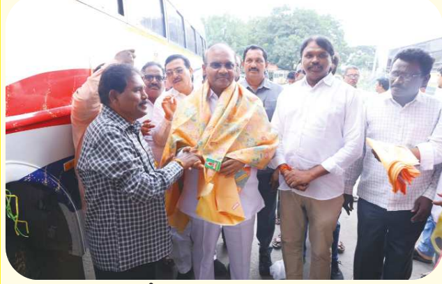
చిలకలూరిపేట పెన్ పవర్ ప్రతినిధి డిసెంబర్ 22

కూటమి ప్రభుత్వం 6 నెలల్లో రాష్ట్ర వ్యాప్తంగా 1400 నూతన ఆర్టీసీ బస్సులు అందుబాటులోకి తెచ్చింది: ప్రతిపాటి త్వరలో 2 వేల బస్సులు రానున్నాయి.