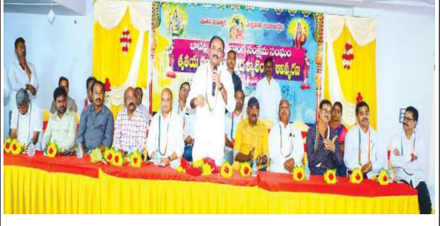
చీరాల, డిసెంబర్ 22, పెన్ పవర్