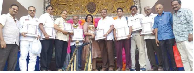
చీరాల, డిసెంబర్ 22, పెన్ పవర్

బెస్ట్ ప్రెసిడెంట్, బెస్ట్ సెక్రటరీ అవార్డులతో పాటు, పలు మె మెంటోలు, ప్రశంసా కవీలు సాధించి, చరిత్ర సృష్టించిన చీరాల వాకర్స్ అసోసియేషన్