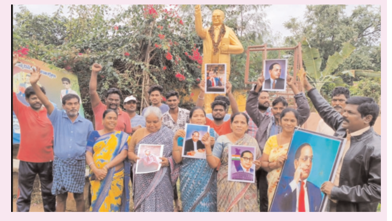
● ఎంపీలతో మింగడీని నివాదాలు

నర్సిపల్లం, పెన్ పవర్ (డిసెంబర్ 20) : కేంద్ర హోం శాఖ మంత్రి అమిత్ షా పార్లమెంట్లో చేసిన వ్యాఖ్యలకు నిరసనగా గ్రామస్థాయిలో కూడా నిరసనలు వెల్లువెత్తుతున్నాయి.