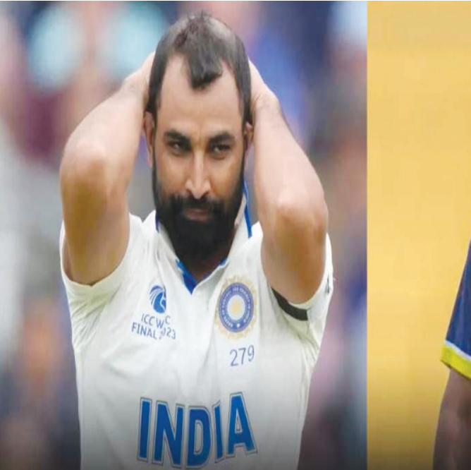
హైదరాబాద్ పెన్ పవర్: టీమిండియా స్టార్ ఫాస్ట్ బౌలర్ మహమ్మద్ షమీ గాయం నుంచి కోలుకున్నాడా లేదా అనే విషయంలో సస్పెన్స్ కొనసాగుతుంది. దేశవారీ వన్డే ఫార్మాట్ లో జరిగే విజయ్ హజారే ట్రోఫీకి తొలి మ్యాచ్ లో రెస్ట్ ఇచ్చారు. విజయ్ హజారే ట్రోఫీ శనివారం

(డిసెంబర్ 21) ప్రారంభం కానుంది. క్రికెట్ అసోసియేషన్ ఆఫ్ బెంగాల్ ప్రకటించిన 20 మంది సభ్యుల జట్టులో షమీకి చోటు దక్కింది. అయితే ఇప్పుడు షమీ హైదరాబాద్ జరిగే ఓపెనింగ్ క్లౌస్ కు దూరంగా ఉండనున్నాడు. రంజీ ట్రోఫీ ద్వారా క్రికెట్ లోకి కంబ్యాక్ ఇచ్చిన షమీ.. ఆ తర్వాత నయ్యర్ ముస్తాక్ అలీ టోర్నీలో గాయపడి కోలుకున్నాడు. ఆస్ట్రేలియాతో జరగబోయే బోర్డర్-గవాస్కర్ ట్రోఫీకి షమీ అందుబాటులో ఉంటాడనే వార్తలు వచ్చినా అతన్ని సెలక్ట్ చేయలేదు. ఇదిలా ఉంటే టీమిండియా కెప్టెన్ రోహిత్ శర్మ.. షమీ మోకాలి వాపుతో ఇబ్బంది పడుతున్నాడని.. అతను 100 శాతం ఫిట్ గా లేడని పెర్ట్ టెస్ట్ ముగిసిన తర్వాత తెలిపాడు. ఫిబ్రవరి 19 నుండి మార్చి 9 వరకు జరగబోయే ఛాంపియన్స్ ట్రోఫీకి అతను అందుబాటులో ఉండాలని భారత క్రికెట్ జట్టు ఆశిస్తోంది. వరల్డ్ కప్ లో గాయపడిన షమీ ఫిబ్రవరి నెలలో ఎడమ చీలమండకు సర్జరీ చేయించుకున్నాడు. లండన్ లోని ఓ హాస్పిటల్ లో ఈ సర్జరీ నిర్వహించారు. ఈ క్రమంలో దక్షిణాఫ్రికా, ఇంగ్లాండ్ తో జరిగిన టెస్ట్ సిరీస్ కు షమీ దూరమయ్యాడు. వీటితో పాటు ఇండియాలో మెగా ఐపీఎల్, టీ20 వరల్డ్ కప్ కు దూరమయ్యాడు. షమీ చివరిసారిగా భారత్ వేదికగా 2023 వరల్డ్ కప్ పైన్ లో ఆస్ట్రేలియాపై ఆడాడు.