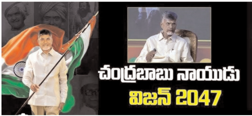
పురుషులకు ద్వారా గ్రూపులు స్వయం ఉపాధి పొందేలా వ్యాపార అభివృద్ధికి చర్యలు ముఖ్యమంత్రి చంద్రబాబును విజనరీ లీడర్ అంటారు తొలి విడతగా అనకాపల్లిలో ప్రారంభం