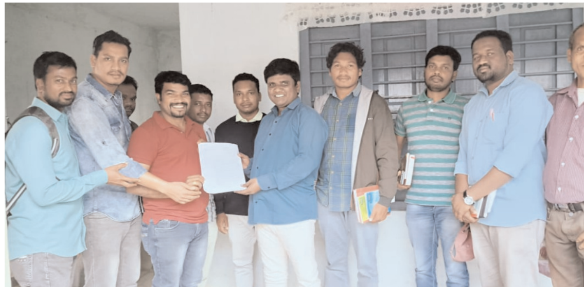
పనులు సమయానికి అయిపోవాలి, కానీ జీతాలు సమయానికి ఇవ్వరు అని బాధపడుతున్న ఉద్యోగులు మండల సిబ్బంది నిర్దేశనా?

గూడెం కొత్తవీధి, పెన్ పవర్, డిసెంబర్ 12: అల్లూరి సీతారామరాజు జిల్లా గూడెం కొత్తవీధి మండల కేంద్రంలో ఎంపీడీవో కార్యాలయంలో మండలంలోని పలు సచివాలయాలలో వివిధ శాఖల్లో పని చేస్తున్న సచివాలయ ఉద్యోగులు తమకు జీతాలు సకాలంలో అందించాలని కోరుతూ ఎంపీడీవో