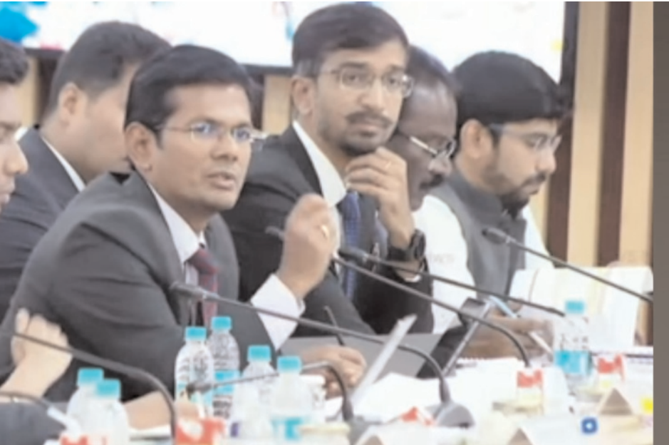
రాష్ట్ర ముఖ్యమంత్రి నారా చంద్రబాబు నాయుడు