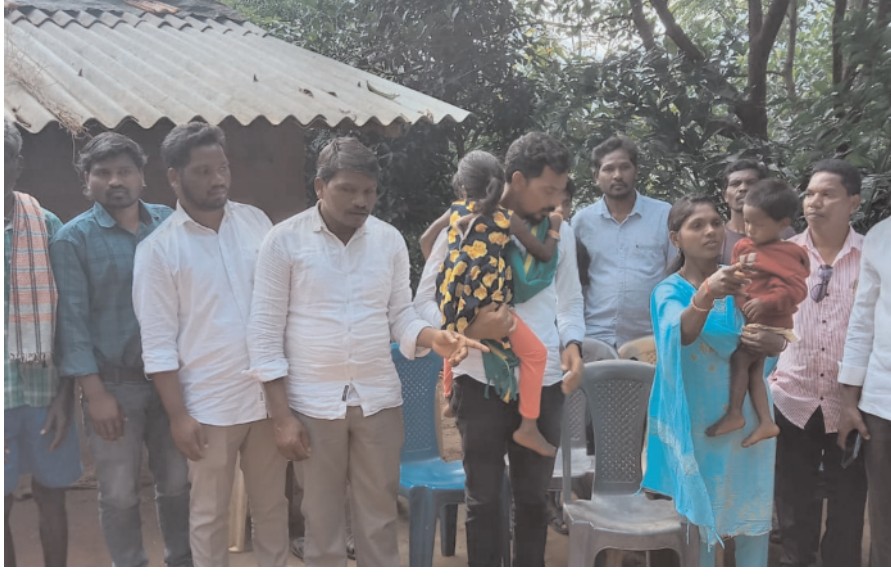
చలపతిరావు తదితరులు పాల్గొన్నారు.