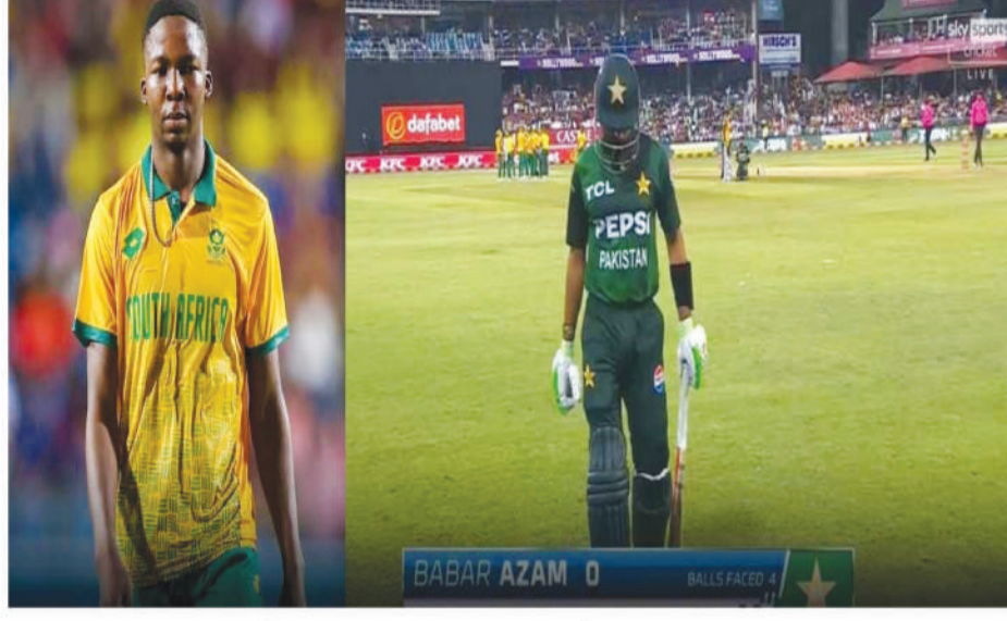
20 ఓవర్లలో 8 వికెట్ల సమ్మతికి 172 పరుగులకే పరిమితమైంది. మహ్మద్ రిజ్వాన్ చివరి వరకు క్రికెట్ లో ఉన్నప్పటికీ ఉపయోగం లేకుండా పోయింది. డిసెంబర్ 13 న ఐదు జట్ల మధ్య రెండో టీ20 జరుగుతుంది.