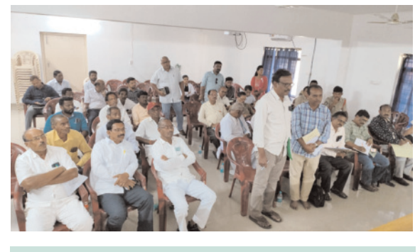
● మన్యం జిల్లా సబ్ కలెక్టర్ శ్రీమాత్స్యం.