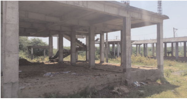
పలువురు కోరుతున్నారు. పిఆర్ఎకె ని వివరణ కోరగా త్వరలో పనులు పూర్తిచేసేలా చర్యలు తీసుకుంటామని పేర్కొన్నారు.

ఏలూరు డిసెంబర్ 27 పెన్ పవర్: దెందులూరు నియోజకవర్గంలోని ఏలూరు రూరల్ మండలం, పెదపాడు మండలం, పెదవేగి మండలాల్లోని మాడేపల్లి, కలవర్రు, వీరమ్మకుంట, పాత ముప్పర్రు, వసంతవూడ, ఏపూరు, గోపన్నపాలెం, బాపిరాజు గూడెం గాలూరుగూడెం, భోగాపురం గ్రామాల్లోని సచివాలయ భవన నిర్మాణాలు అసంపూర్తిగా దర్జనమిస్తున్నాయి. మాడేపల్లి, ఏపూరు, వీరమ్మ కుంట రైతు సేవా కేంద్రాల భవన నిర్మాణాలు మధ్యలోనే నిలిచిపోయాయి. చైకాపా ప్రభుత్వ హయాంలో మంజూరైన భవనాలకు బిల్లుల చెల్లింపుల్లో జాప్యం జరిగింది. దీంతో గుత్తదారులు పనులను మధ్యలో వదిలేశారు. సచివాలయాల పరాయి పంచన నడుస్తున్నాయి. కూటమి ప్రభుత్వం దృష్టి సారించి చివరి స్థాయిలో నిలిచిపోయిన సచివాలయ భవన నిర్మాణాలను పూర్తిచేయాలని