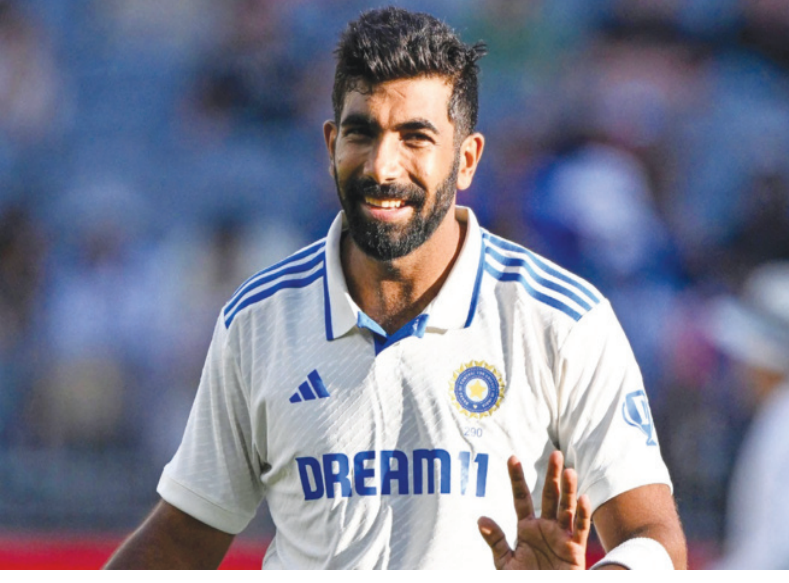
సమర్పించుకున్న జస్టీత్ బుర్రూ... ఈ ఒక్క మ్యాచ్లోనే నాలుగు సిక్సర్లు బాదించుకోవడం విశేషం. గణాంకాల పరంగా బుర్రూకు చెత్త ప్రదర్శనే అయినప్పటికీ, ఈ మ్యాచ్ లో భారత బౌలర్లలో తాను అత్యుత్తమం కావడం గమనార్హం. కాగా, ఐసీసీ టెస్ట్ ర్యాంకింగ్లో నంబర్ 1 బౌలర్గా జస్టీత్ బుర్రూ కొనసాగుతున్న విషయం తెలిసిందే.

టెస్ట్ కెరీర్లో ఒకే ఇన్నింగ్స్లో అత్యధికంగా 99 పరుగులు సమర్పించుకున్న స్టార్ పేసర్ అంతకుముందు నమోదైన 88 పరుగుల రికార్డు బద్దలు టెస్ట్ కెరీర్లో మొత్తం 11 సిక్సర్లు కొట్టించుకున్న బుర్రూ ఒక్క మెల్బోర్న్ టెస్టులోనే 4 సిక్సర్లు సమర్పించుకున్న వైనం