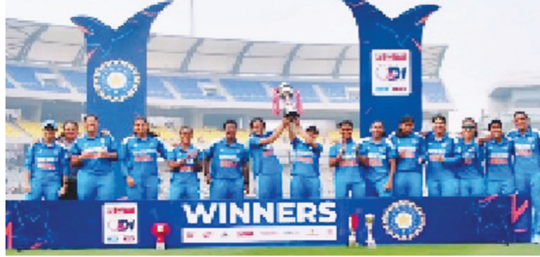
23 పరుగులతో చెలరేగిపోయింది. గత మ్యాచ్లో రాజించిన స్ఫూర్తి మంధాన, హర్షీన్ డియోల్ మూడో వన్డేలో మాత్రం సింగిల్ డిజిట్ కే పరిమితమయ్యారు. వెస్టిండీస్ తో డి20 సిరీస్ కూడా డీమిండియా కైవసం చేసుకున్న సంగతి తెలిసిందే.

మూడో వన్డేలో 162 పరుగులకే కుప్పకూలిన వెస్టిండీస్ 28.2 ఓవర్లలో లక్ష్యాన్ని ఛేదించిన భారత జట్టు ఆల్ రౌండర్ ప్రతిభతో అదరగొట్టిన దీప్తి శర్మ